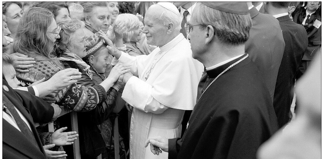
Jonas Paulius II Lietuvoje (1993 m.).

žiaus kelionė „Mercedes-Benz“ G klasės papamobiliu („papa“ italų kalba reiškia popiežius, „(auto)mobile“ – automobilis). Techninės konkrečių papamobilių savybės paprastai neskelbiamos, tačiau žinoma, kad po 1981 m. Vatikane įvykusio