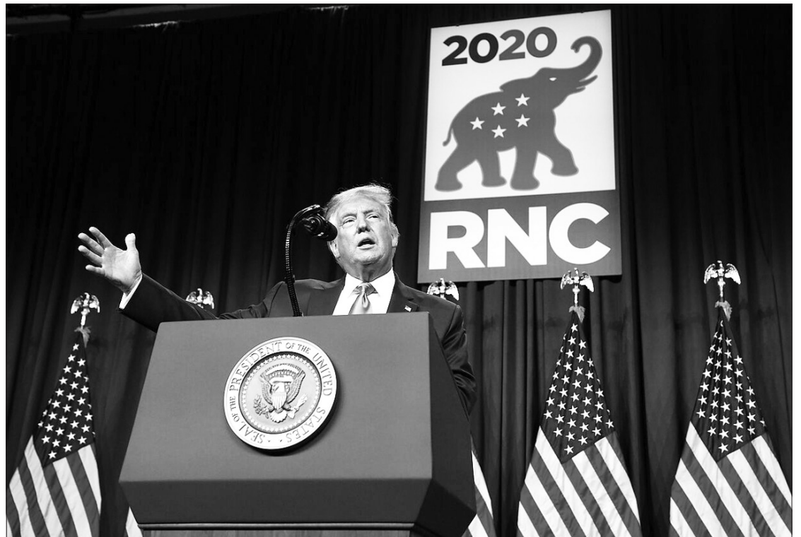
Donaldas Trampas sutiko tapti Respublikonų kandidatu į prezidentus.