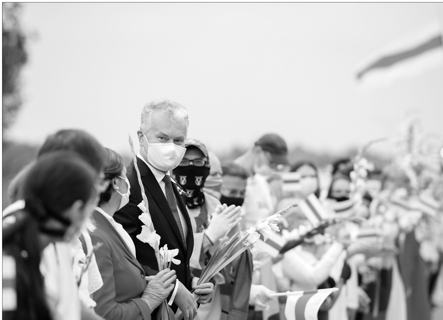
Lietuvos Prezidentas Gitanas Nausėda dalyvavo akcijoje „Laisvės kelias“.

„Pasaulio istorija vėl ir vėl įrodo, kad net ir tvirtiausios ir didžiausia baime pagrįstos tvirtovės egzistuoja trumpiau negu pačios tikisi. Dėl to, kad jos neturiu idealų ir nėra dėl ko aukotis, nes jos grįstos saviapgaule, apgaule, šantažu, apgaudinėjimu. Ar verta dėl to rizikuoti savo sveikata ir gyvybe? Tad šandien tariame – mes su tavimi, laisva Baltarusija, ir tiesiam tau savo ranką“, – kalbėjo