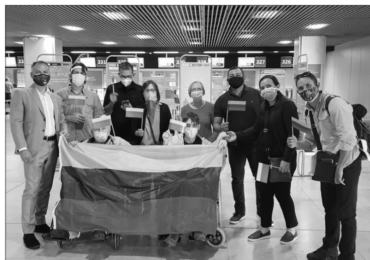
Iš Venesuelos grįžo pirmieji 9 Lietuvos piliečiai.

mo centras. Humanitarinei krizei Venesueloje toliau gilėjant, Lietuvos ambasada