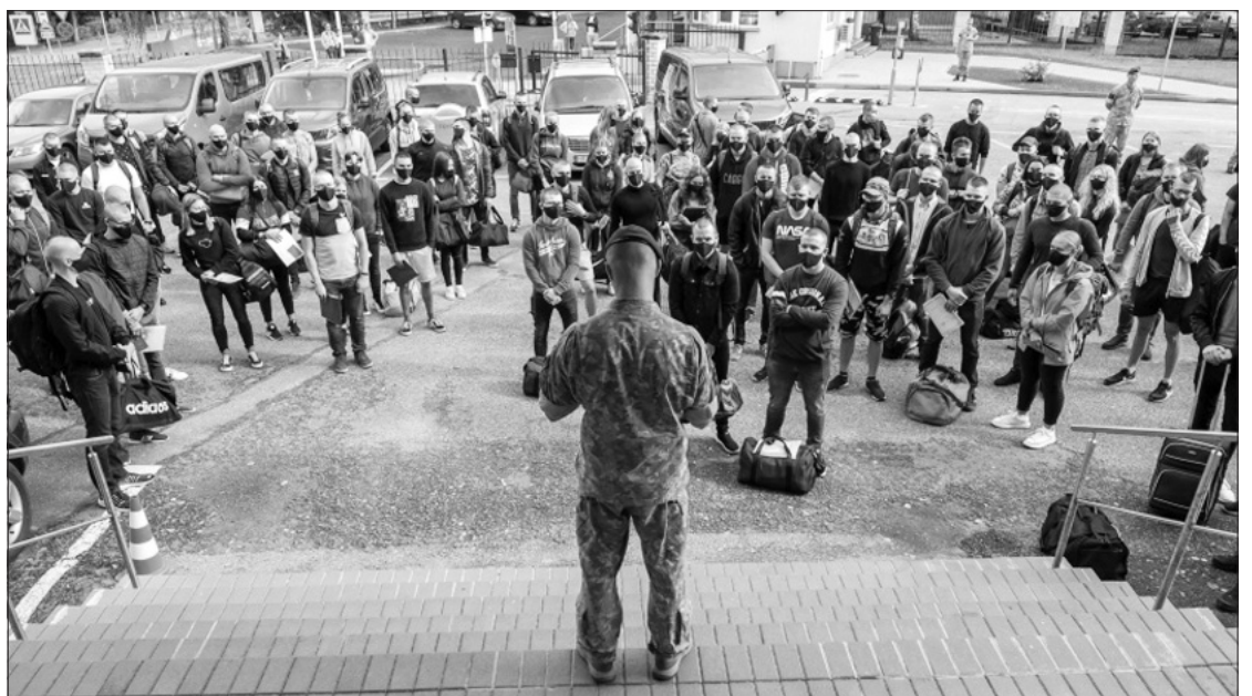
Stojantieji į Generolo Jono Žemaičio Lietuvos karo akademijos kariūnų gretas.

Priimti jaunuoliai, aprūpinti uniformomis ir susipažinę su pagrindinėmis kario taisyklėmis, rugpjūčio 30 d. išvyks į Didžiojo Lietuvos etmono Jonušo Radvilos mokomąjį pulką Rukloje. Ten jie išeis Bazinį kariūno kursą ir įgis individualaus rengimo pagrindus. Spalio mėnesį prisiekę Lietuvos Respublikai kariūnai tęs studijas Lietuvos karo akademijoje. LR KAM