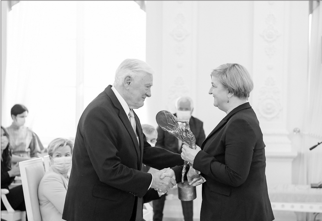
Lecho Kačynski vardo „Prometej“ apdovanojimas įteikiamas Prezidentui Valdui Adamkui.

2020-08-25 Šalies vadovas Gitanas Nausėda kartu su pirmąja ponia Diana Nausėdiene dalyva-