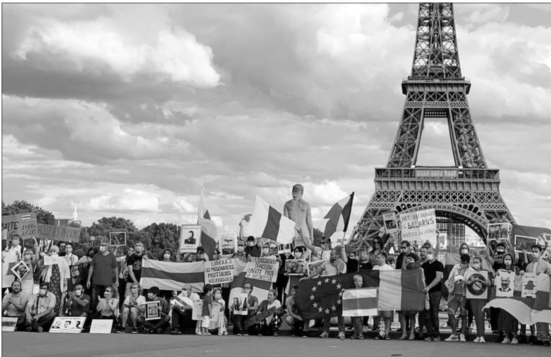
Lietuvos ir Baltarusijos bendruomenių Paryžiuje, Prancūzijoje surengtas Baltijos kelio 31-ųjų metinių minėjimas. LR URM