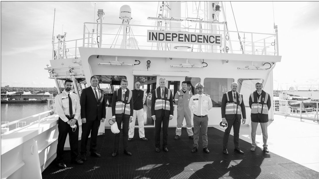
Lietuvos Prezidentas G. Nausėda Suskystintųjų gamtinių dujų terminale.

2020-08-28 penktadienį lankėsi Klaipėdos neatsiejama Lietuvos ener- Lietuvos Respublikos Suskystintųjų gamtinių dujų getinės infrastruktūros dalis. Prezidentas Gitanas Nausėda (SGD) terminale, kuris yra 2014 metų pabaigoje pradėjęs