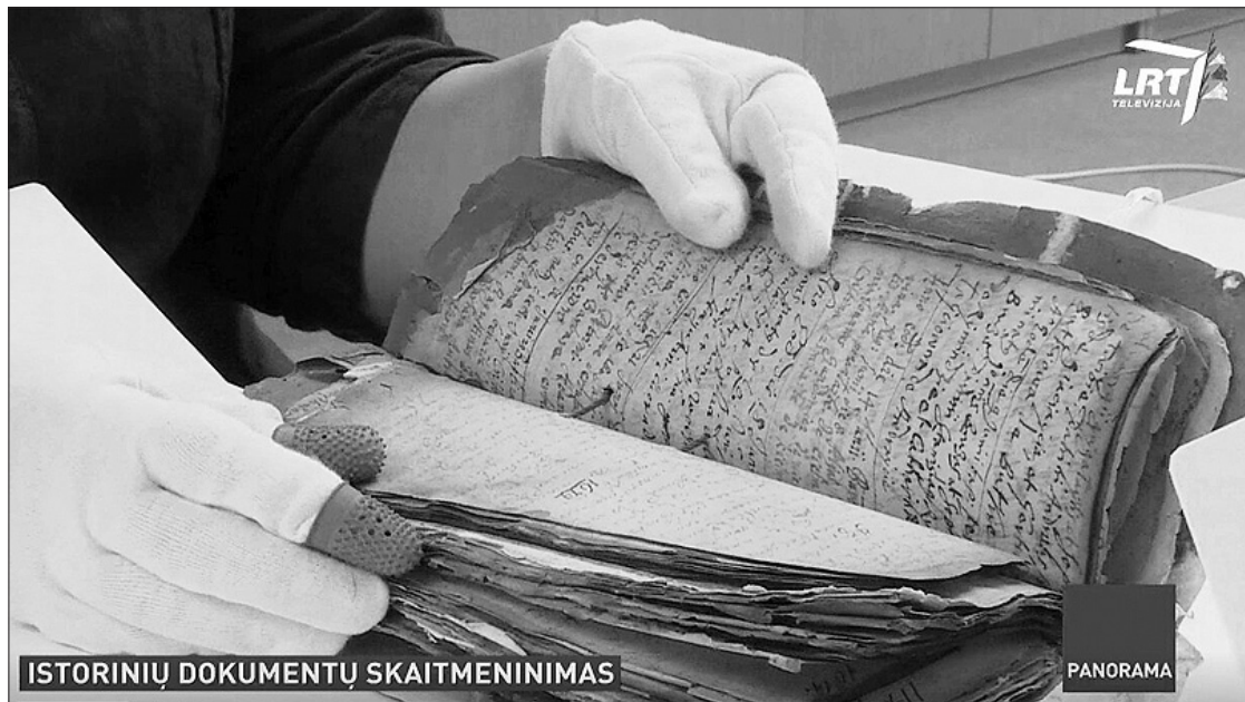
ISTORINIŲ DOKUMENTŲ SKAITMENINIMAS

Jau nuo rugsėjo 4 d. parodą „Popiežiaus Jono Pauliaus II vizitą Lietuvoje prisimenant“ bus galima apžiūrėti virtualių parodų tinklalapyje http://virtualios-parodos.archyvai.lt/lt ir Vilniaus bei Kauno viešajame transporte.