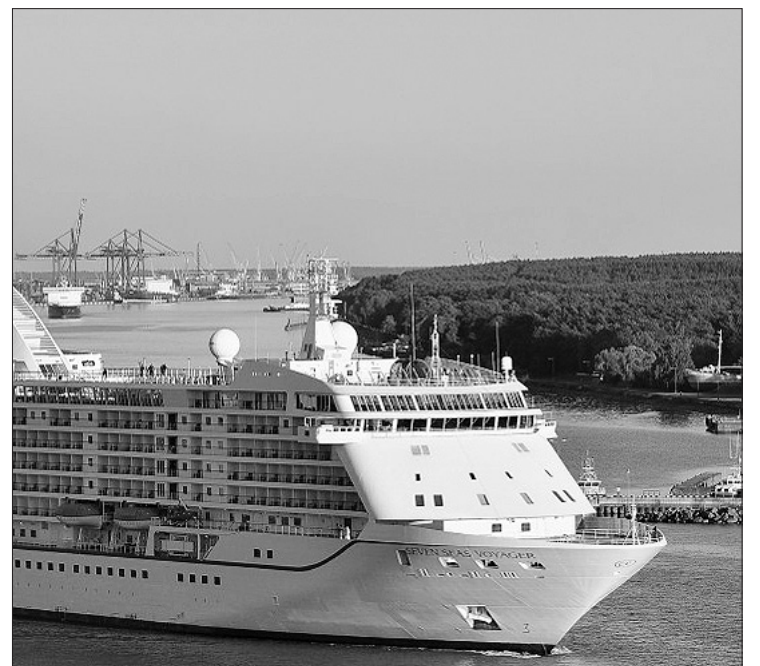
Kruizinis laivas Klaipėdoje.