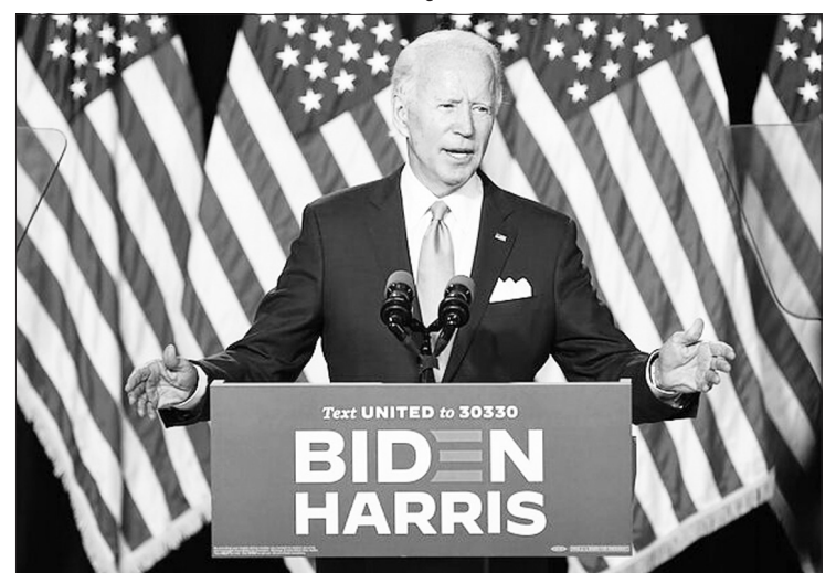
JAV demokratas Joe Bidenas.

„Ir nesuklyskite, būdami vieningi mes galime įveikti