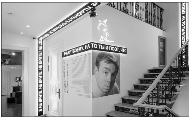
Maskvos Voznesensko centras.