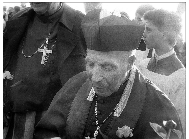
Kardinolas Vincentas Sladkevičius Trijų Kryžių paminklo atidengimo metu.