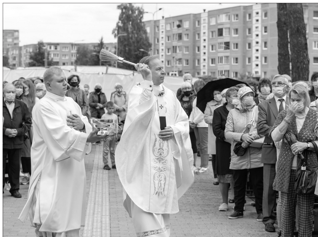
Arkivyskupas Gintaras Grušas laimina Grigiškių Šventosios Dvasios parapijos tikinčiuosius.

bus iššūkis kiekvienam grigiškėčiui, keliaujant pro šalį, matyti ne tik architektūrinį paminką, bet Dievo namus tarp mūsų – matomą, akimis nematomos dvasinės tikrovės ženklą. Suvokus, kad čia gyvena Dievas, kad čia yra visų malonių versmė, pasikeičia gyvenimas.