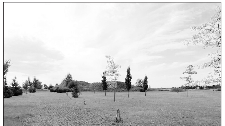
Saulės mūšio vieta.