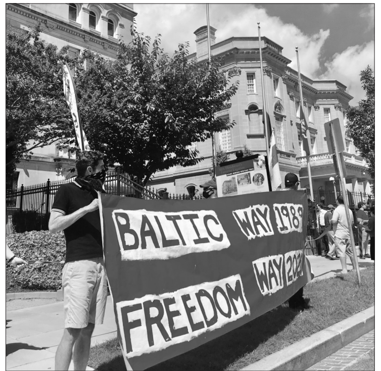
JAV sostinėje rugpjūčio 23 d. įvyko „Laisvės kelio“ akcija. LR URM