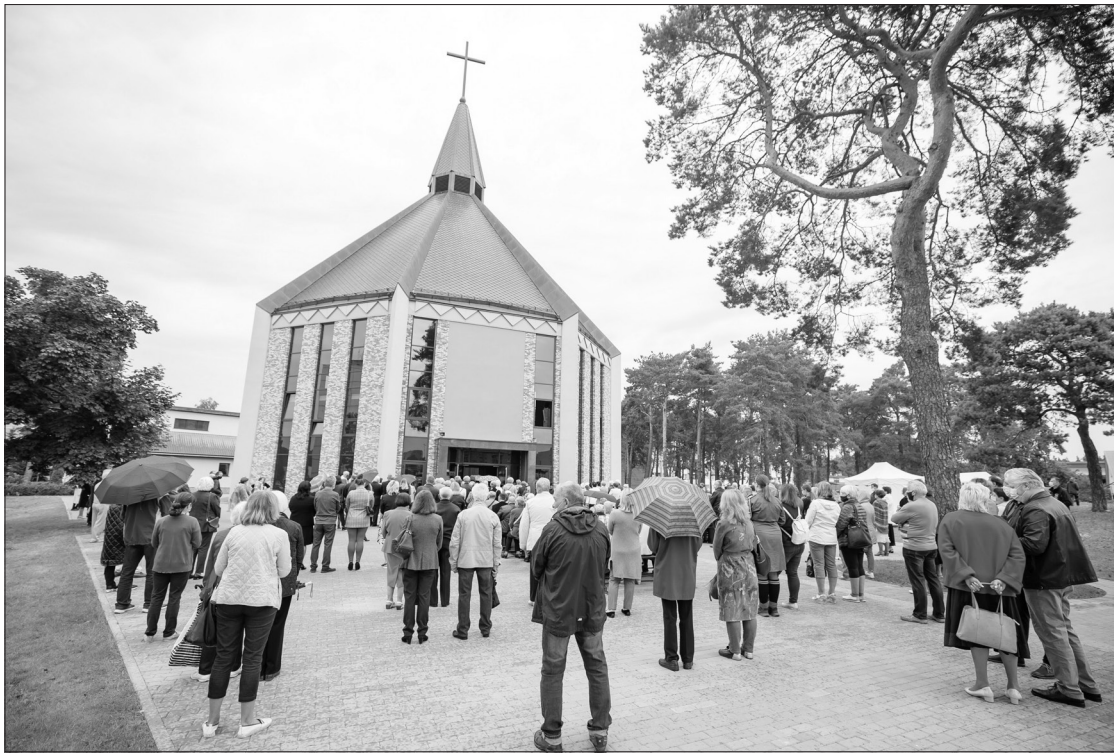
Grigiškių Šventosios Dvasios bažnyčia.