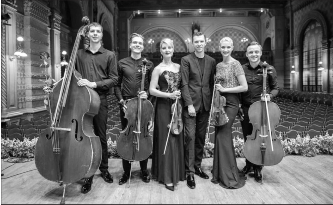
Naujų idėjų kamerinis orkestras NIKO.