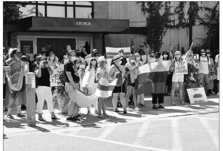
Šventiniai renginiai vyko Toronte, Vasagoje, Vankuveryje. LR URM