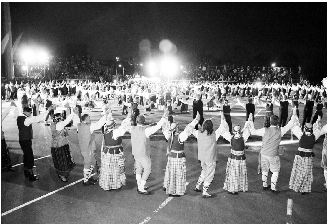
Šokių šventės Argentinoje „Ten, kur Nemunas banguoja“ akimirka.

„Provincijos paveldu“ ir „Provincijos Parlamento paveldu“.