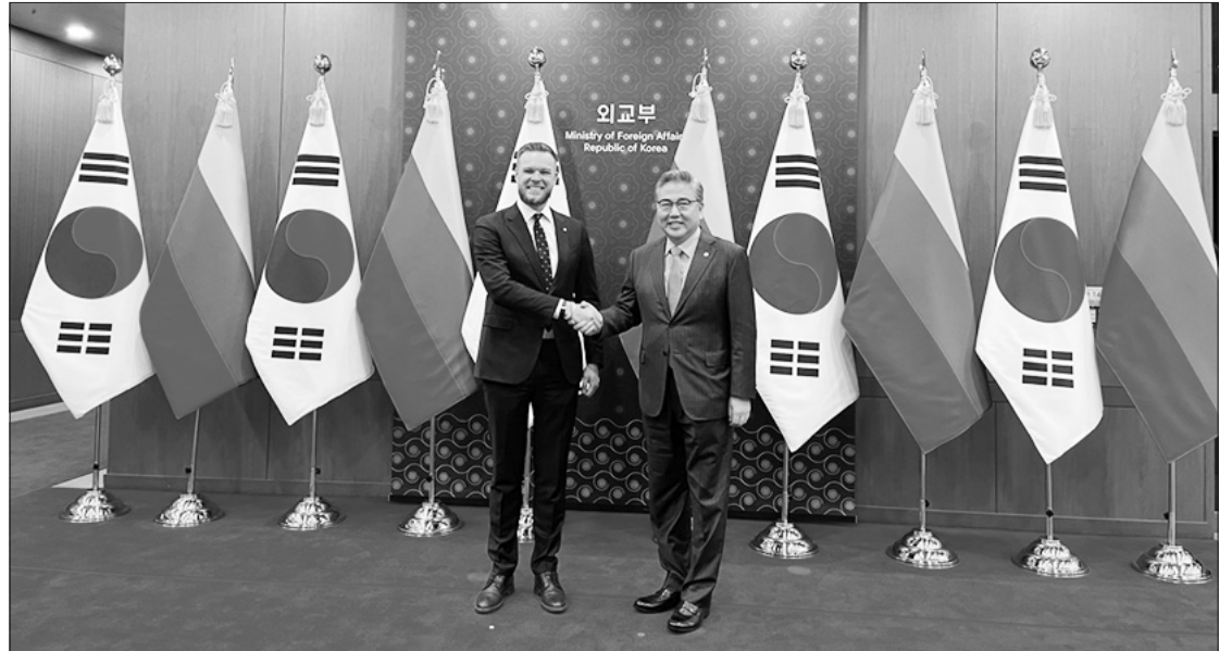
LR užsienio reikalų ministras Gabrielius Landsbergis (dešinėje) oficialaus vizito Korėjos Respublikoje metu susitiko su šalies užsienio reikalų ministru Park Jin.

Sausio 13 dieną LR užsienio reikalų ministras Gabrielius Landsbergis oficialaus vizito Korėjos Respublikoje metu susitiko su šalies užsienio reikalų ministru Park Jin. G. Landsbergis susitikime teigė, kad suskystintų gamtinių dujų terminalas laivas „Independence“ yra šalių bendrystės ir nepriklausomybės simbolis, nuo kurio prasidėjo spartus abiejų valstybių bendradarbiavimo augimas ekonomikoje, energetikoje, išmaniųjų technologijų srityse. Penktadienį Korėjos užsienio reikalų ministras taip pat informavo apie suteiktus eksporto leidimus paukštienai iš Lietuvos.