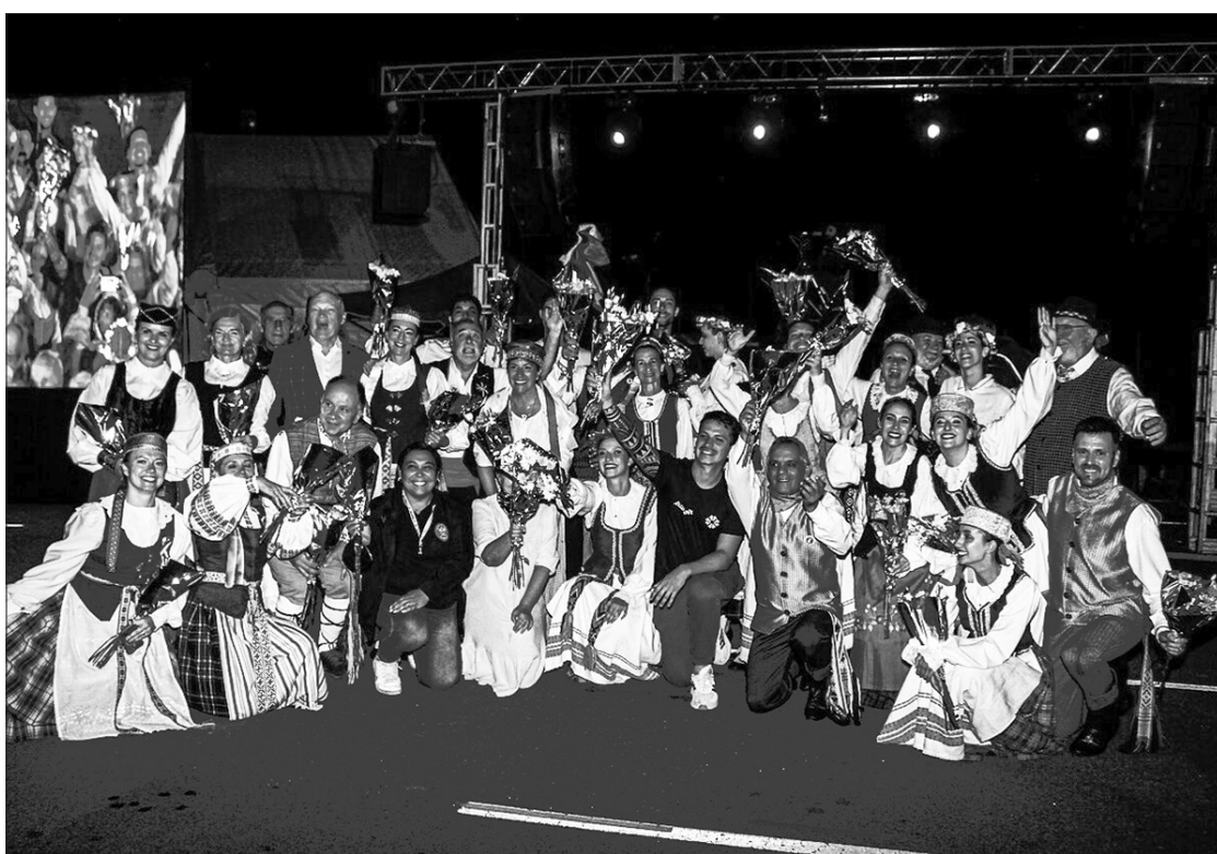
Šokių šventėje Argentinoje „Ten, kur Nemunas banguoja”.

Kitas svarbus momentas -- buvo paskelbti visi sveikinimai: LR Prezidento Gitano Nausėdos, Lietuvos Respublikos Ministrės Pirmininkės Ingridos Šimonytės, LR Seimo Pirmininkės Viktorijos Čmilytės-Nielsen, LR kultūros ministro Simono Kairio, užsienio reikalų ministro Gabriėliaus Landsbergio, visus sveikinimus su ispaniš-