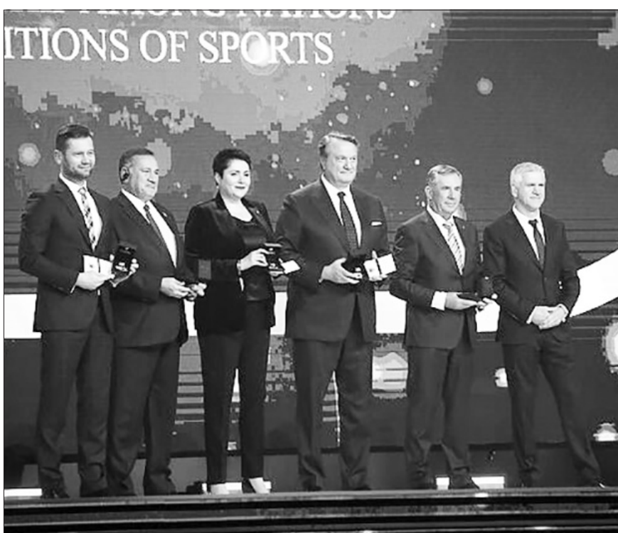
Daina Gudzinevičiūtė (trečia iš kairės).

Olimpinė čempionė, Lietuvos tautinio olimpinio komiteto (LTOK) prezidentė Daina Gudzinevičiūtė sausio 10 d. dalyvavo iškilmingoje Lenkijos sporto apdovanojimų gala ceremonijoje. Varšuvoje vykusiam renginyje D. Gudzinevičiūtei buvo įteiktas tarptautinių „Auksinio mangusto“ (angl. „Golden mongoose“) sporto apdovanojimų medalis, rašoma LTOK pranešime žiniasklaidai.