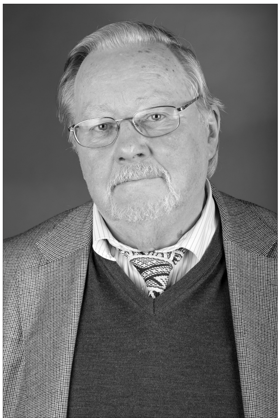
Prof. Vytautas Landsbergis, 2014 m.

– Grįžti į tėvynę. Jei yra norinčių „prasigyvenus kitur grįžti tėvynę“ (tebejaučiant ją kaip tėvynę), tai dar visai neblogai. O grįžti nedraudžia jokia Konstitucija, jokie įstatymai. Grįžk ir gyvenk ir prasigyvenk toliau Lietuvoje.