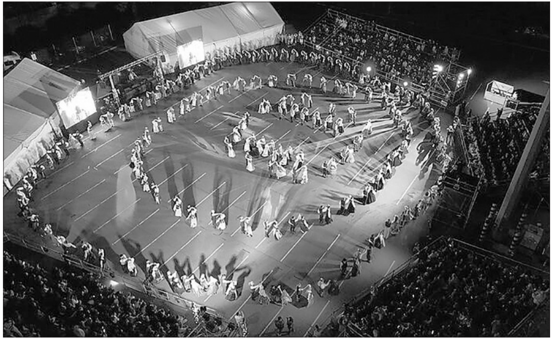
Argentinoje praūžė šokių šventė: lietuviškas renginys Beriso mieste sutraukė per 1200 žiūrovų.