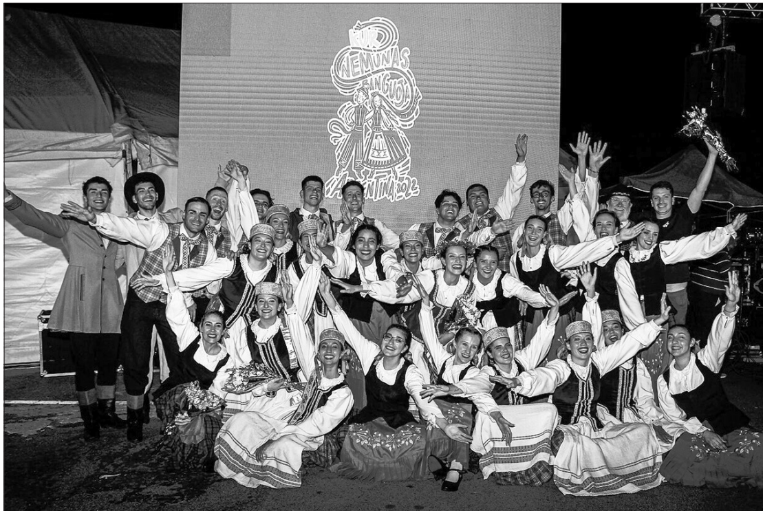
Šokių šventės Argentinoje „Ten, kur Nemunas banguoja” akimirka.

visus sveikinimus su ispaniš- (Nukelta į 10 psl.)