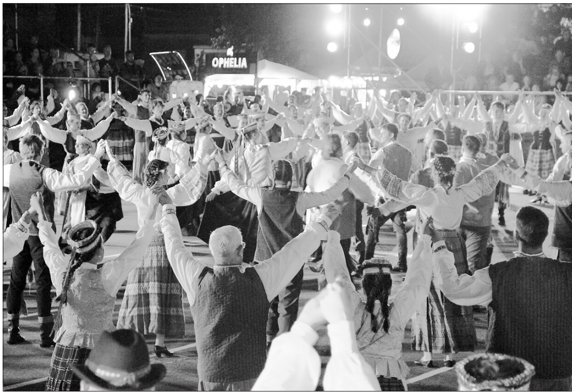
Šokių šventė Argentinoje „Ten, kur Nemunas banguoja“, skirta Argentinos lietuvių draugijos „Nemunas“ lietuvių tautinių šokių kolektyvų „Skaidra“ ir „Nemunas“ 50 metų jubiliejams.

Šokių šventę Argentinoje „Ten, kur Nemunas banguoja“ jau anksčiau pripažino, išreiškė palaikymą ir paskelbė „Municipaliniu paveldu“ Beriso miesto savivaldybė, o Buenos Airių provincijos vyriausybė paskelbė Šventę