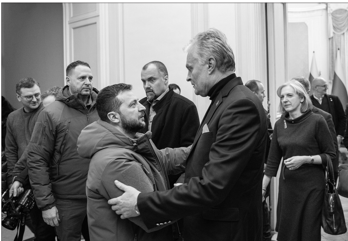
Lietuvos Respublikos Prezidentas Gitanas Nausėda (dešinėje) Lvive susitiko su Ukrainos Prezidentu Volodymyru Zelenskiu.

Lietuvos Respublikos Prezidentas Gitanas Nausėda Lvive susitiko su Ukrainos Prezidentu Volodymyru Zelenskiu . Lietuvos vadovas pažadėjo, kad Lietuva tęs nenutrūkstamą karinę, ekonominę ir humanitarinę paramą nuo Rusijos agresijos besiginančiai Ukrainai. Svarbiausi prioritetai šiuo metu yra karinė įranga ir amunicija, padedanti ukrainiečiams siekti pergalių mūšiuose, ir pagalba atkuriant kritinę energetikos infrastruktūrą, į kurią šiuo metu nutaikyti Rusijos raketų smūgiai.