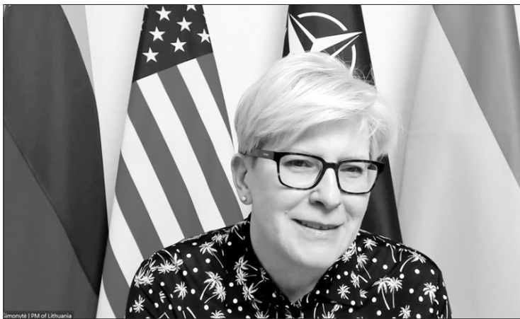
Ministrė Pirmininkė Ingrida Šimonytė.

Ministrė Pirmininkė Ingrida Šimonytė dalyvavo McCaino tarptautinės lyderystės instituto surengtoje nuotolinėje diskusijoje su buvusiu JAV gynybos sekretoriumi, instituto bendradarbiu dr. Marku T. Esperu, kurioje kalbėjosi apie Rusijos karą Ukrainoje, Vakarų šalių paramą ukrainiečiams ir sankcijas Rusijai, autokratiją iššūkį demokratijoms ir taisyklėmis grįstai tarptautinei tvarkai.