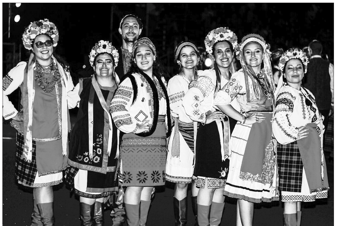
Šokių šventės Argentinoje „Ten, kur Nemunas banguoja“ dalyviai.