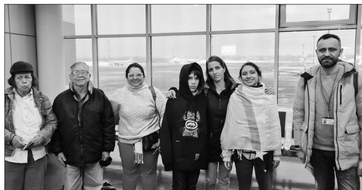
Į Lietuvą iš Venesuelos atvyko dar dvi lietuvių šeimos.

Lietuvos diplomatinėmis pastangomis iš krizės apimtos