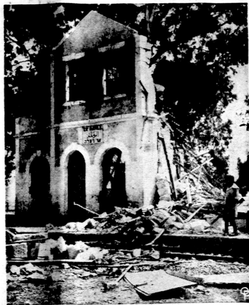
Palestinų žydai teroristai išsprogdino Ramleh geležkelio stotį. Paveiksle matyti, kaip atrodo ta stotis po bombos sprogdimo. Ramleh mieste gyvena apie 10,000 gyventojų ir visi jie yra arabai. Laike sprogdimo vienas žmogus buvo sužeistas.

joj, bet ir mūsų širdyse senelis Vydunas jau sukūrė sau amžiną paminklą. Jo vardą mes gerbsime, kol lietuviai brangins savo rašytoją, o iš Vyduno pavyzdžio mes mokysimės, kol lietuviai brangins taurųjį žmoniškumą ir pasiūkavimą.