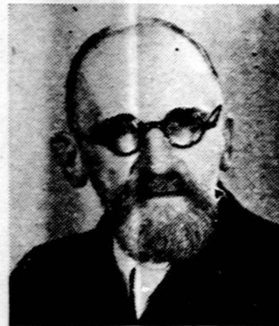
Prof. Vaclovas Biržiška

I visuomeninį darbą sukaktūrininkas stojo dar mokyklos suole. Būdamas studentu Petrapily, jis aktingai veikėia Studentų Draugijoje, kurį laiką jai ir vadovauja. 1905 metų revoliucijai kilus, jis Lietuvos Socialdemokratų Partijos slaptos spaustuvės rinkėjas ir vedėjas, jis joje spausdina partijos atsisaukimus ir kitus raštus ir juos platina; jis pradeda rašyti socialdemokratų ir kitų pažangiųjų laikraščiams elėnraščius, vaizdelius ir