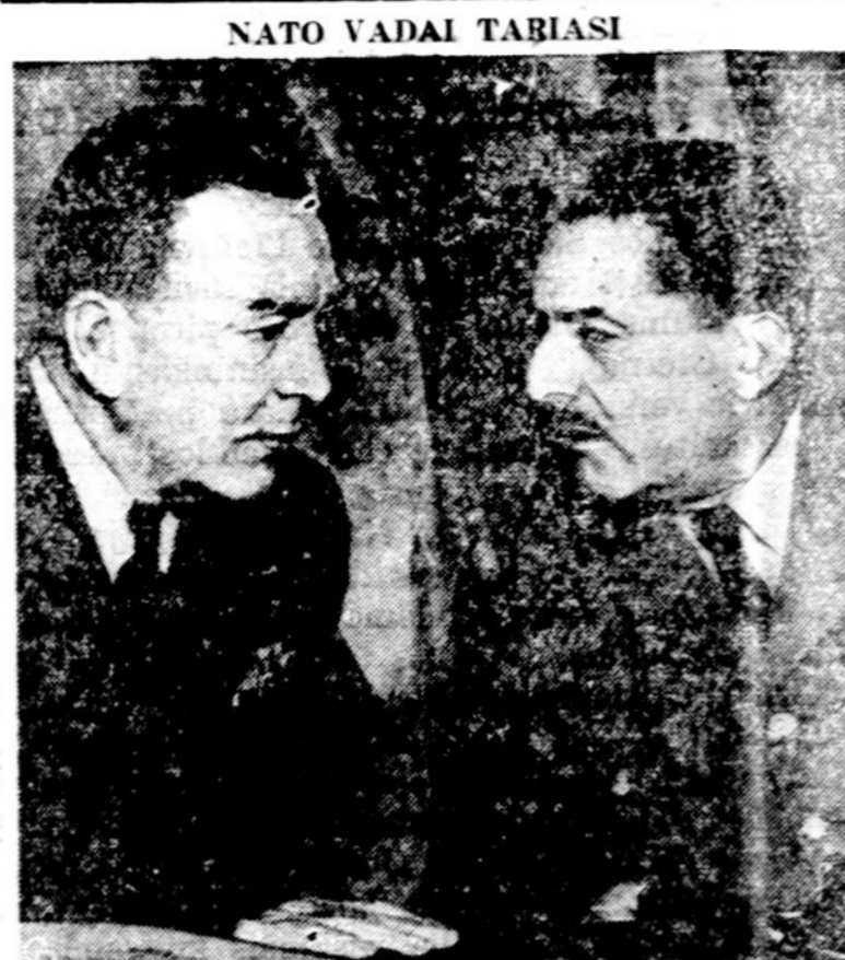
Pereitą savaitę Washingtonė ejo Siaurės Atlanto Sąjun- gos karo vadų pasitarimai. Paveiksle matome adm. Ar- thur W. Radford, jungtinių štabų viršininką (kairė), ir prancūzų generolą Guillaume.

Pirmuoju vyriausioju sektoriu. Rusų sektoriuje miesto burmistru (majoru) kitą dieną susirinko rusų išrinko socialdemokrata komendanto gen. Kotikovo prof. Reuterį. Cia pataikė "rinkti" miesto atstovai po- komunistams ant skau- sėdžio rinkti miestui bur- dziausios nuospaudos. Ru- mistrą Ebertą, kuris ir šian-