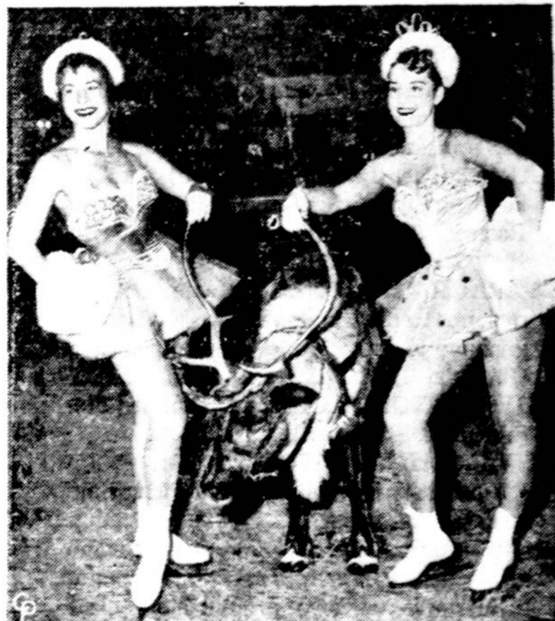
Kalėdų Senelis, ar Santa Claus, atvažiuoja per Kalėdas pasikinkęs elnią. Tą nebetoliną šventę primena žiūro- vams tarptautinėje parodoje New York'e elnias ir dvi bostoniškes pačiuožininkės.