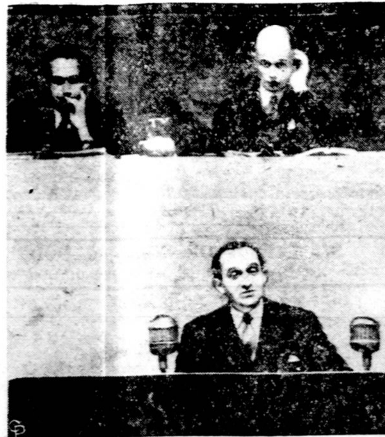
Prancūzijos ministerių pirmininkas P. Mendés-France kalbėjo Jungtinių Tautų seime ir ta proga siūlė, kad keturios didžiosios valstybės susirinktų konferencijai gegužės mėnesį, kada Paryžiuje pasirašytos sutartys bus jau visų valstybių patvirtintos.