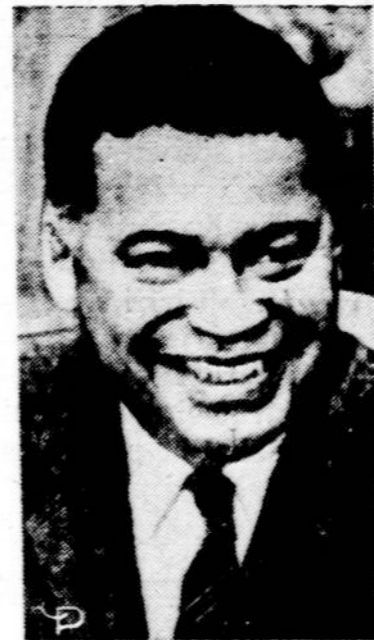
Mass. sen. Edward Brooke, vienintelis negras senate, bus laikiniu respublikonų konvencijos pirmininku. Pirmą kartą negru suteikiama tokia garbė.

Ta proga vėl prisimintina, kad sovietai savo kolonijom Europoje nemanom duoti net ribotą laisvės ir siekia dar daugiau kultūringų tautų pavergti.