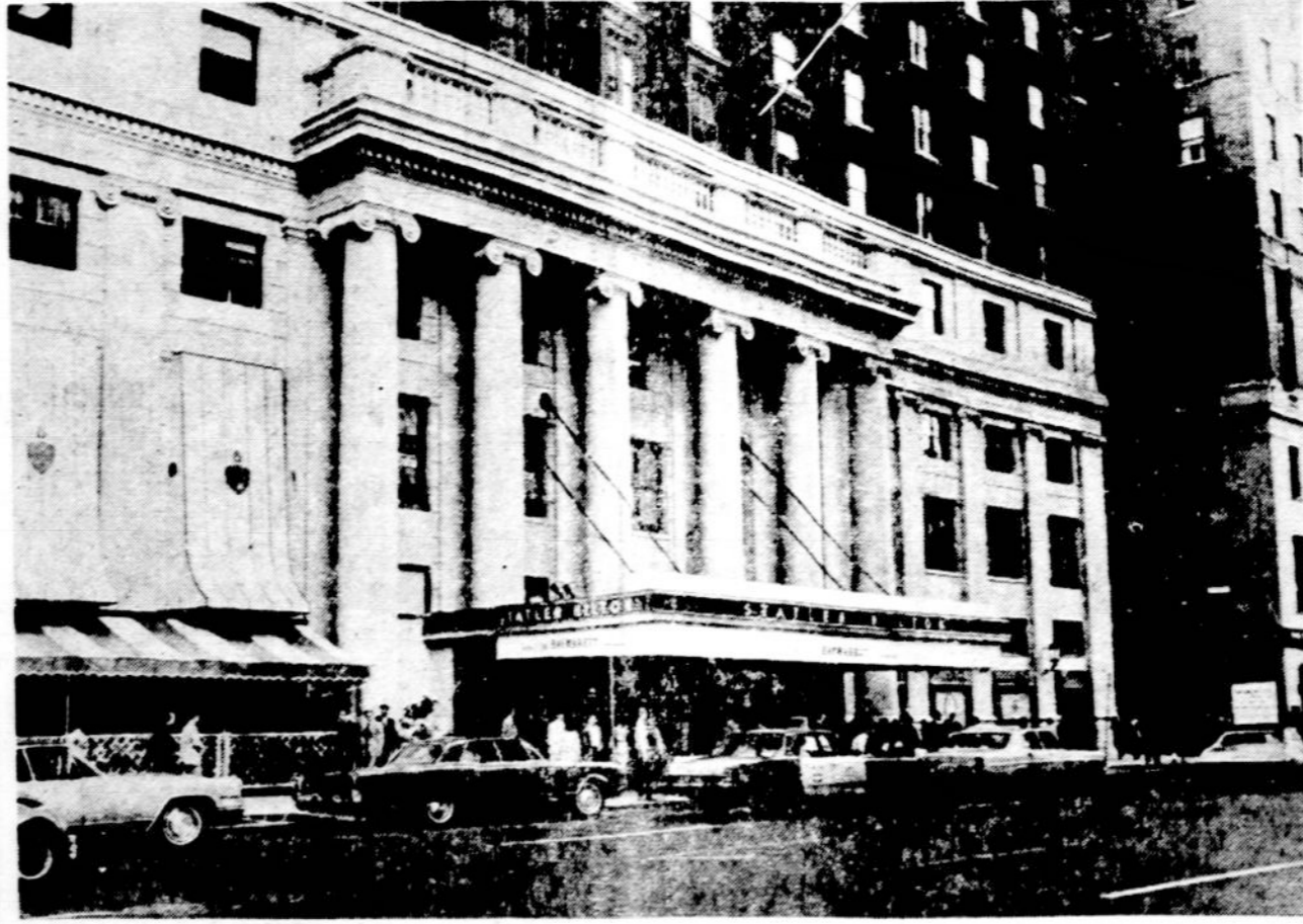
Tai Statler-Hilton viešbutis New Yorke, kuria me rugpiūcio 30—rugsėjo 2 d. posėdžiaus Pasaulio Lietuvių Bendruomenės Trečiasis Seimas.

Kelios mylios nuo Milano aerodromo nūkrito lėktuvas. Jame buvo 95 keleiviai ir 10 įgulos narių. Žuvo 15 asmenų ir yra sužeistų.