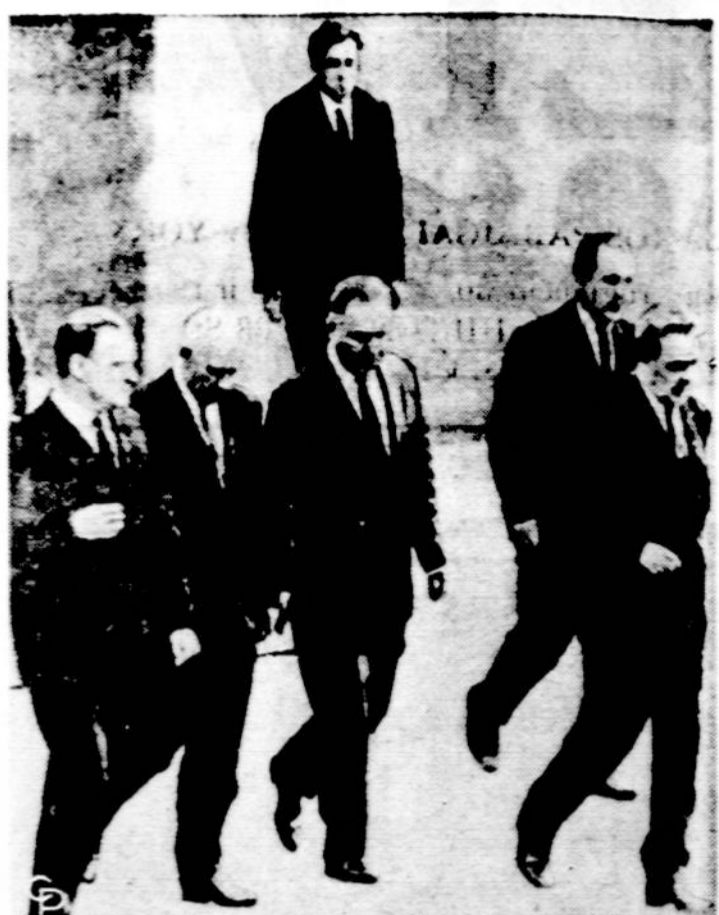
Vaizdas iš Čekoslovakijos ir Sovietų Sąjungos pasitarimų. Tai sovietų delegacija, dešinėje pirmas — Brežnev.

Darbdaviai skaičiuoja, kad kiekvienas darbininkas laimėjo nuo 90 ct. iki $1 per valandą, todėl per tris metus 11 plieno fabriky turėsia atlyginimams išleisti pusantro biliono dolerių daugiau, negu iki šiol. Pakėlimas palies ir 150,000 darbininkų dirbančių kituose plieno fabrikuose. Taigi, iš viso pagal tą sutartį 11 plieno bendrovių per tris metus išlaidų turėsiančios daugiau nei bilioną dolerių, A-