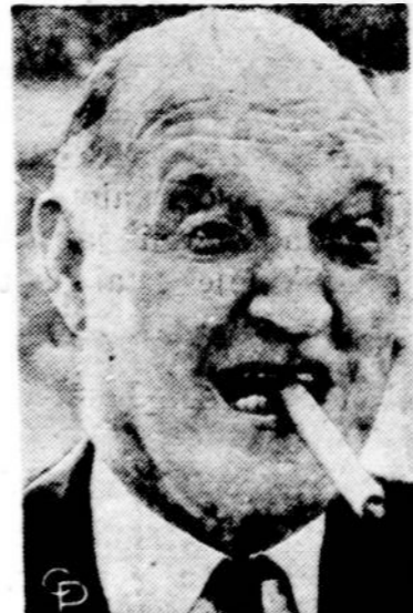
Demokratų partijos pirmininkas John Bailey.