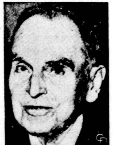
Atominės bombos tėvu vadina mas vokiečių prof. Otto Hahn, miręs Goettingene, sulaukęs 89 metų amžiaus. Jis surado atomo suskaldymo būdą 1938 m. 1941 m. gavo Nobelio premiją.

Numatoma padėti miestams statyti daugiau naujų butų.