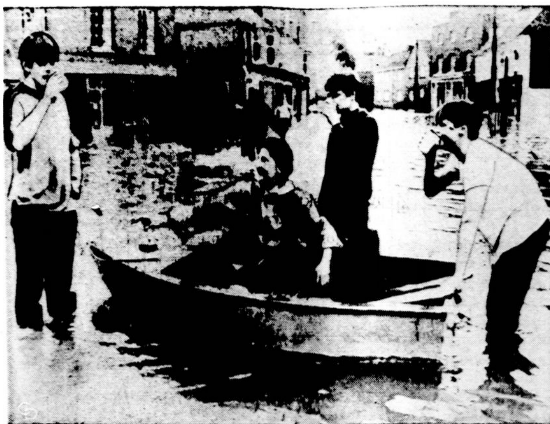
Pietinėje Anglijoje buvo didelis potvynis. Jis pa lietė 1,000 kv. mylių plotą, įskaitant ir Londoną. Taip atrode Hadlow miesto gatvė, tam potvyniui siūbtelėjus į miestą.