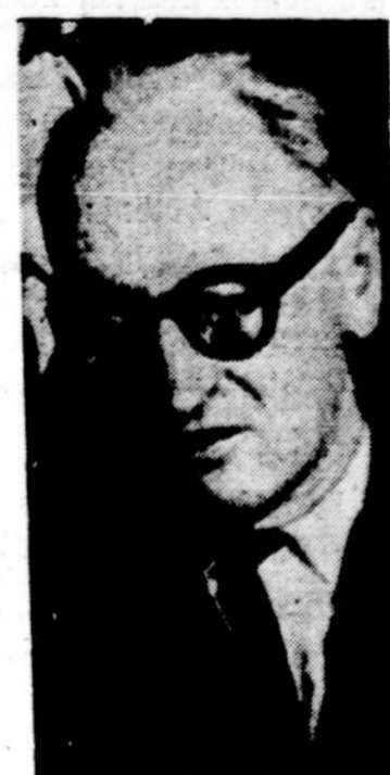
Čekoslovakijos užsienio reikalų ministras Jiri Hajek, kurio nenkenčia Maskva, buvo priverstas atsistatydinti.