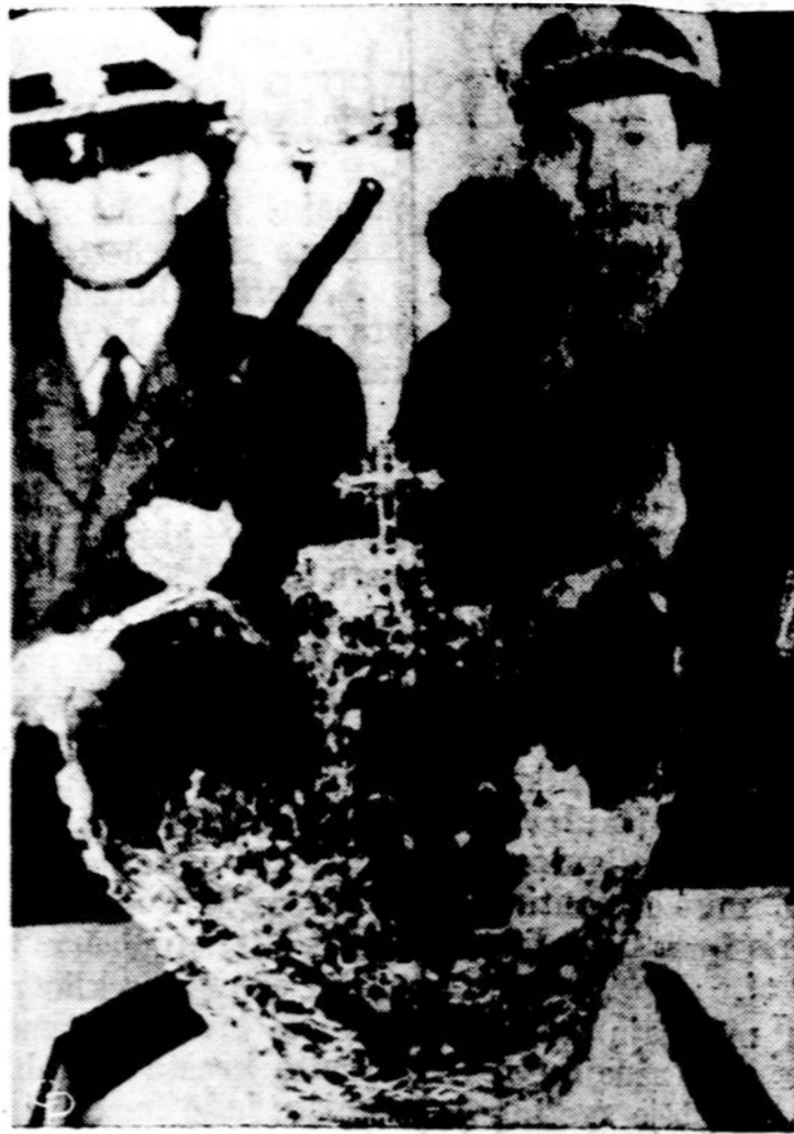
Jie saugoja 5 mil. dol. vertės Andų karūną Frankfurto viešbutyje (Vokietijoje). Ten ji pirmą kartą rodoma Eu-ropeje. Karūna yra 400 metų senumo ir turi 453 smarag-dus. Kolumbijos Andų kalnų papuotai tą karūną paskyrė "Mūsų brangiai Andų deivei" už jų išgelbėjimą nuo epi-demijos.