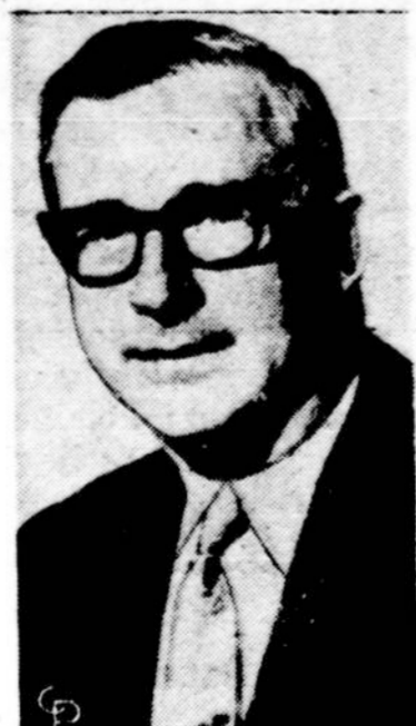
Naujasis Aeronautikos ir erdvės administracijos viršininkas dr. Thomas Paine, pakeitęs atsistatydinusių James Webb.