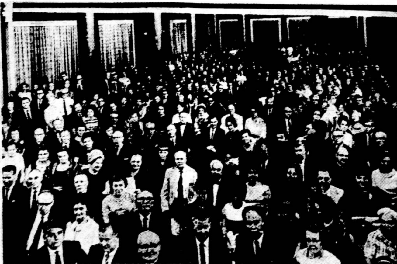
PLB Trečiojo seimo iškilmingojo po sėdžio 1968 m. rugsėjo 1 d. dalyvių dalis.

Taip atsitiko Vokietijoje Miuncheno zoologijos sode. Mergaitė su savo motina stovėjo kitapus perkaso ir mėtė drambliui duonos gabaličius. Dramblys, ištiesęs savo straublį, apjuosė mergaitę, įsikėlė į aptvarą ir tris kartus ją užmynė priešakinę koją.