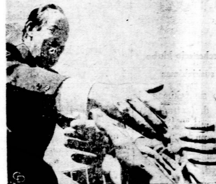
Rinkimų įkarštyje. Viršuje respublikonų kandidatas Nixon New Yorko mieste taksio vairuotojui pasirašo savo pavarde. Apacioje demokratų kandidatas Humphrey Los Angeles mieste sveikinasi su jį apgulusiai piliiečiais.