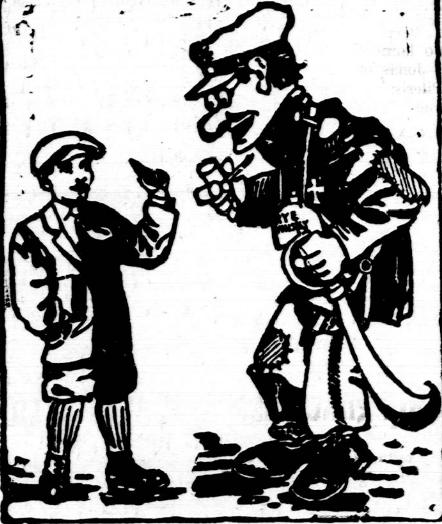
MAIKIO SU TĖVU PASIKALBĖJIMUS VEDA STASYS MICHELSONAS

— Tfu!.. tfu!.. — Ei, tėve, kodėl taip spiudaisi?