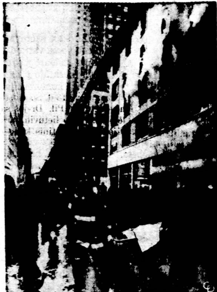
Ugniagesiai neša žuvusius ir sužeistuosius iš gaisro, kuris kito New Yorke dideliuose 5 siųs gatvės namuose. Čia devyni žmonės žuvo, septyni sunkiai apdegę, o daugybė kitų buvo išgelbėta iš mirties pavojaus.

— Norėjau, pani, šia proga ir tave padaryti laimingu,