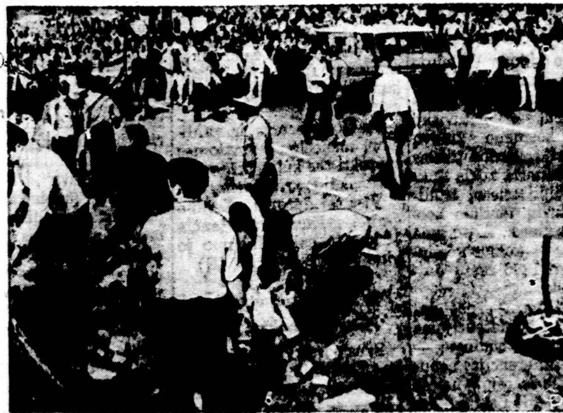
Kai lenktynių automobiliai 180 mylių greičiu įvažiavo į lenktynes stebėjusią 5,000 minia Covingtone, Ga., žuvo 11, o sužeistų buvo daugiau kaip 50 žmonių.