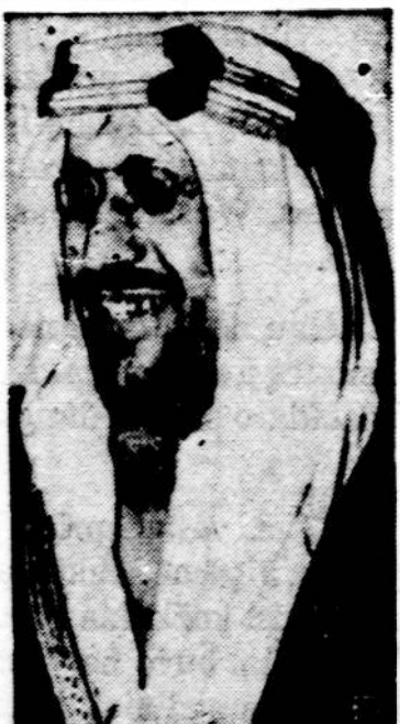
Buvęs Saudi Arabijos karalius, daugiau nei 100 žmonių vyras, neseniai miręs Graikijoje 67 metų amžiaus.