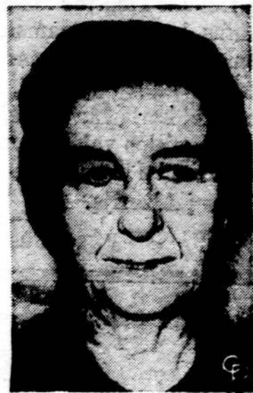
Golda Meir, 71 m. amž., neseniai mirusio Izraelio ministro pirmininko Eshkolio įpėdinė.