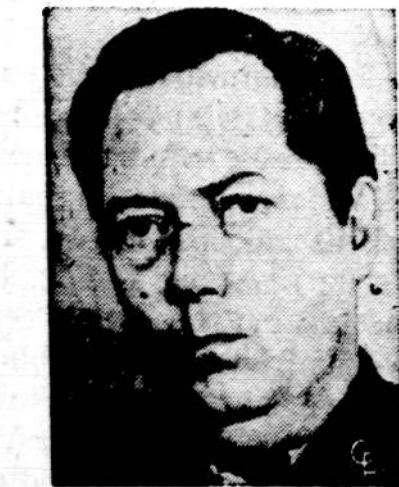
New Orleanso prokuroras Jim Garrison, kuris buvo iškėlęs bylą Clay Shawui, kaltindamas jį už dalyvavimą šamokse nužudyti prez. Kennedį. Prisiekiusįjį teismas Shawą išteisino.