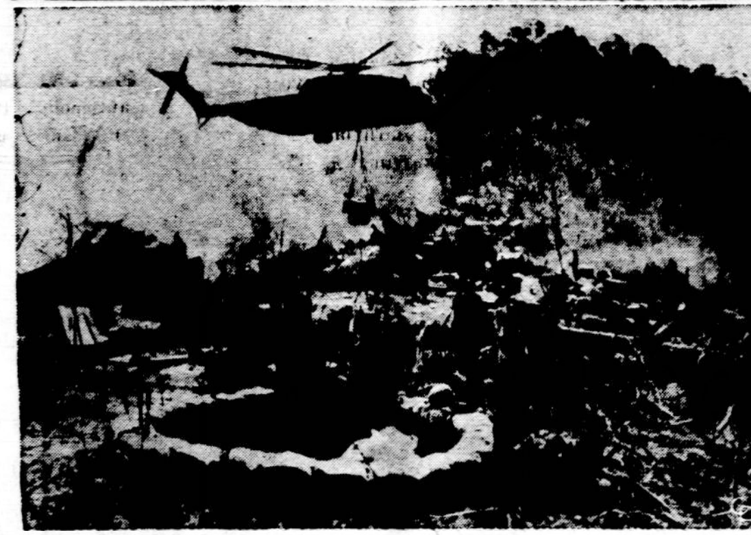
Viršuje matome žemėlapy pažymėtą A Shau Valley sritį Pietų Vietname. Šiaurės Vietname jas naudoja savo kariuomenei suteikti ir pulti pajūrio miestams Da Nang, Hue ir Quang Tri. Apačioje — ten dabar įsitvirtinę amerikiečių kariai, kuriems helikopteriai pristato ginklus ir kt.