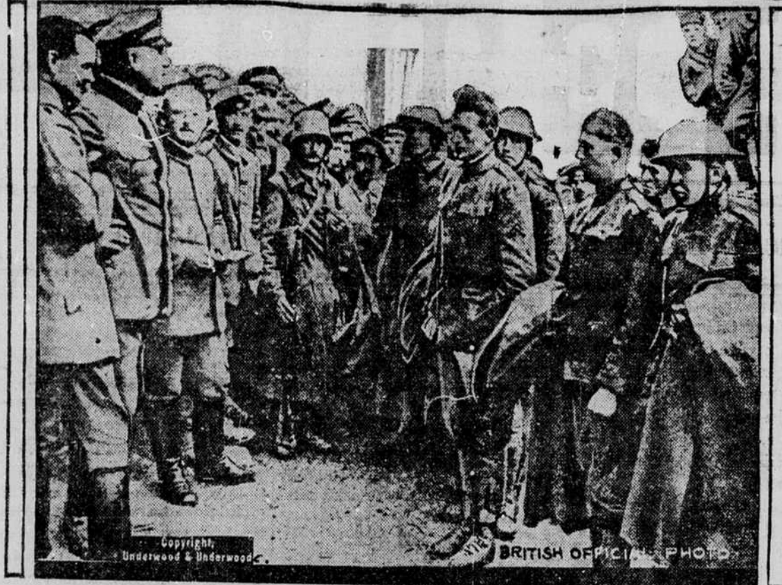
PIRMI AMERIKONAI NELAISVĖJE.

Paveikslėlis parodo pirmą būrėlį Amerikos karių, patekusių vokiečių nelaisvėn prieš keletą savaitių. Vokiečių oficerai (iš kairės) klausinėja amerikonus, kurie stovi iš dešinės (du amerikoni be kepurų).