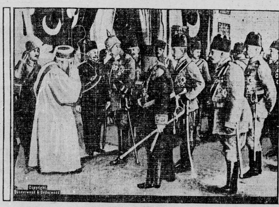
KAIZERIS IR TURKŲ SULTANAS. Kaizeris neseniai atkank savo talkininką Turkijos sultaną Konstantinopolij. Paveiksliis parodo judviejų susitikimą. Sultanas yra vyras baltuose drabužiuose. Kaizeris yra vyras vokiškam šalme su pakelta prie šalmo ranka.