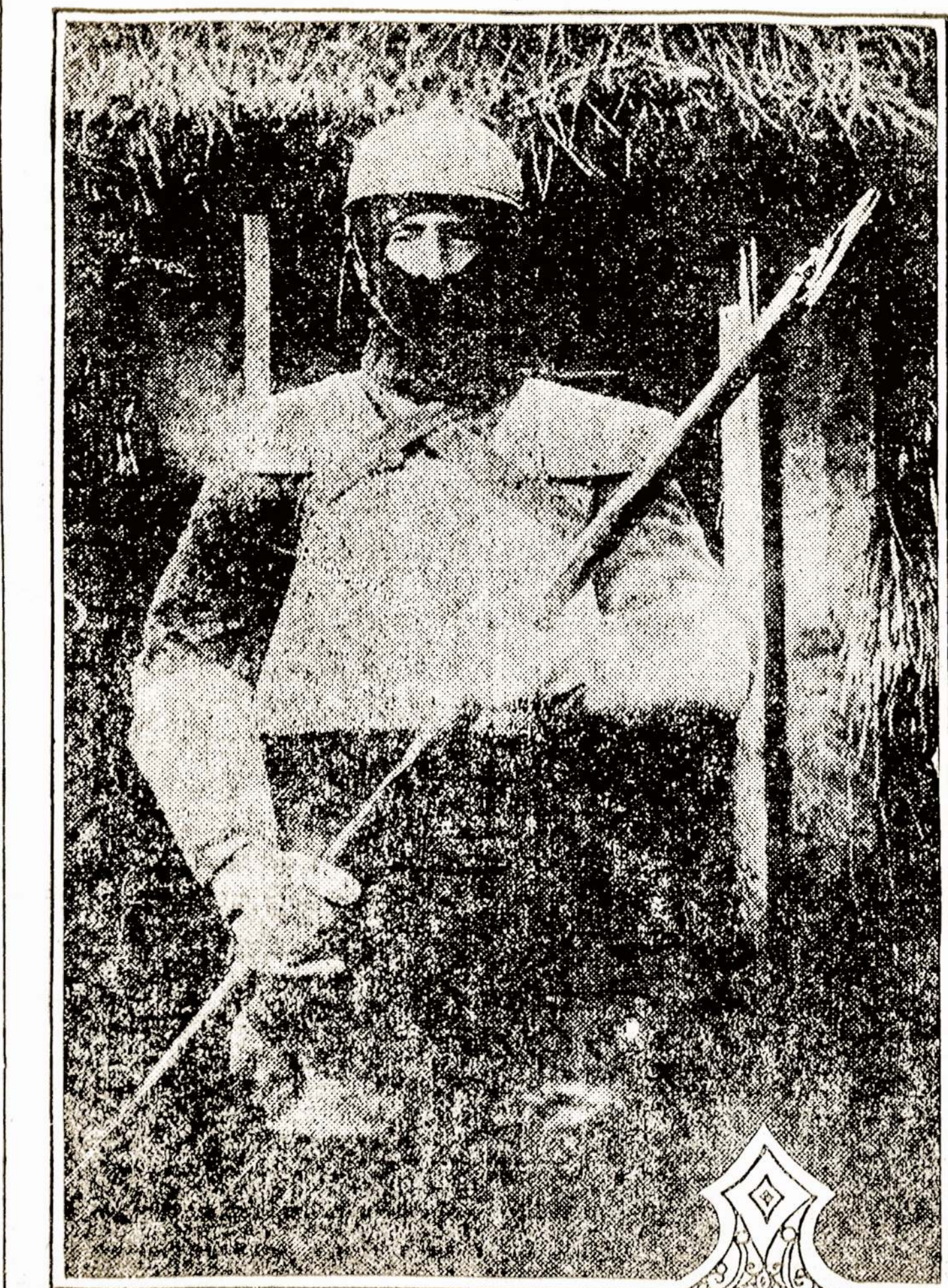
Italų kareivis, priklausantis prie taip vadinamo "mirties burio." Šių kareivių pareigos yra labai pavojingos. Jie turi nupjaustyti priešų vielų užtvarus, kad prirengus pėstininkams galimybė padaryti ataką ant tranšėjų, kurios randasi už tų užtvary.

JACKSON, Mich. — Karpenterių unija nubalsavo reikalaut 55c valandoje vietoj 45c, kuriuos dabar gauna karpenteriai.