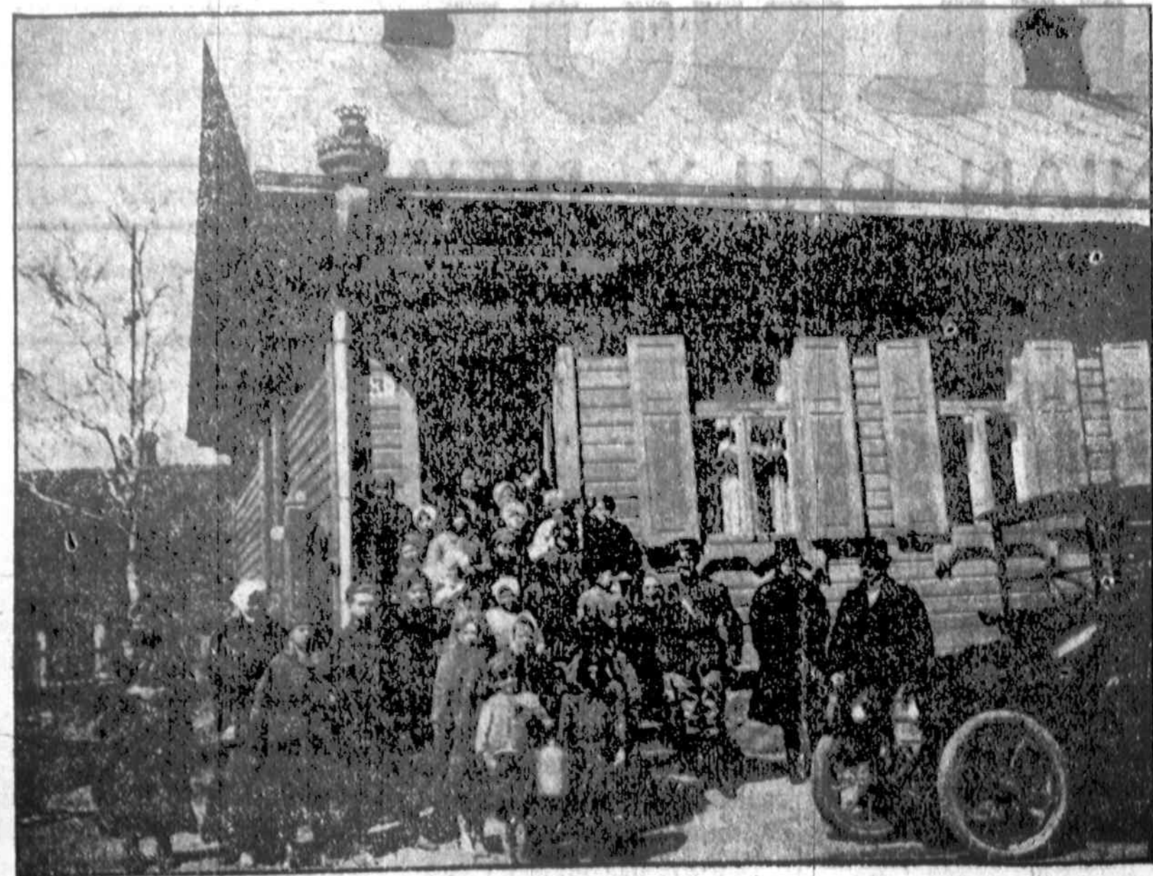
Viena Lietuvių Draugijos nukentėjusiems del karės šelpiti įstaiga — Valgykla, Kaune. Balandžio mėnesis nors saulėta, bet nešilta diena. Moters, mergytės įsisupusios šiltesnėmis skepetomis, bet vaikučiai ir mergiškės beveik visi basi. Didžiausias badas Lietuvoj tai autuvo ir rubų. Prie įstaigos beturčiams šelpiti stovi automobilius, atgabėnęs amerikiečių misiją valgyklai apžiūrėti.

Visų tų priežasčių deliai vargas tarp bednesniųjų šluoksnijų buvo ir yra didelis, o tokių skaičius siekia miestuose ir 30—50