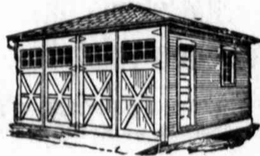
MURINIS arba MEDINIS

Dar kitame veikale—"Budais senovės lietuvių ir žemaičių"