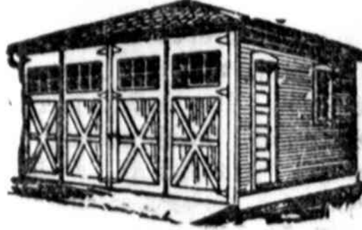
MURINIS arba MEDINIS Geros rūšies pastatyti garažai $10 įmokėti

Jei jus turite lotą ir norite pasistatyti namą, mes patatysime ir finansuosime jį. Del tolimesnių informacijų šaukite, rašykite arba atsiųskite kuponą už toki darbą kurį jus interesuoja.