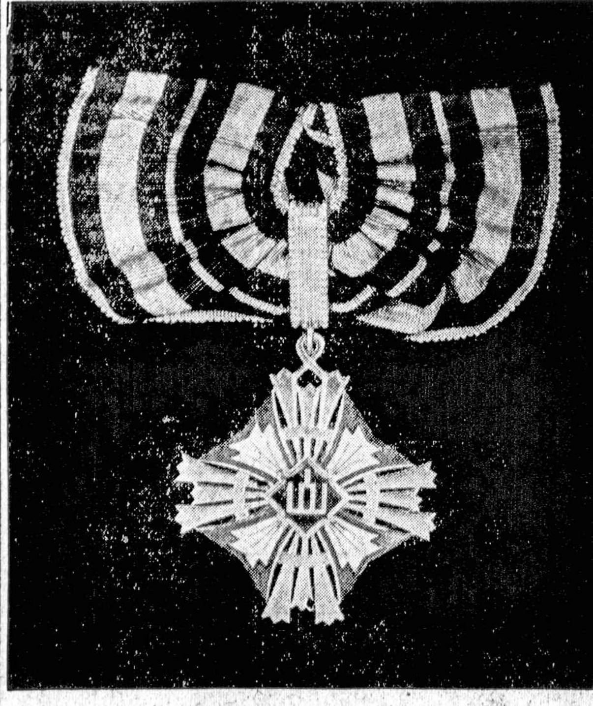
Did. Lietuvos Kunigaikščio Gedimino medalis, įteiktas Miss Mary McDowell gegužės 27 d., 1931 m.

Chicago Settlement vedėja, žinoma visuomenės veikėja, pereiną trečiadienį apdovanota Did. Liet. Kun. Gedimino Ordenu už jos pasidarbavimą lietuvių išeivių labui.