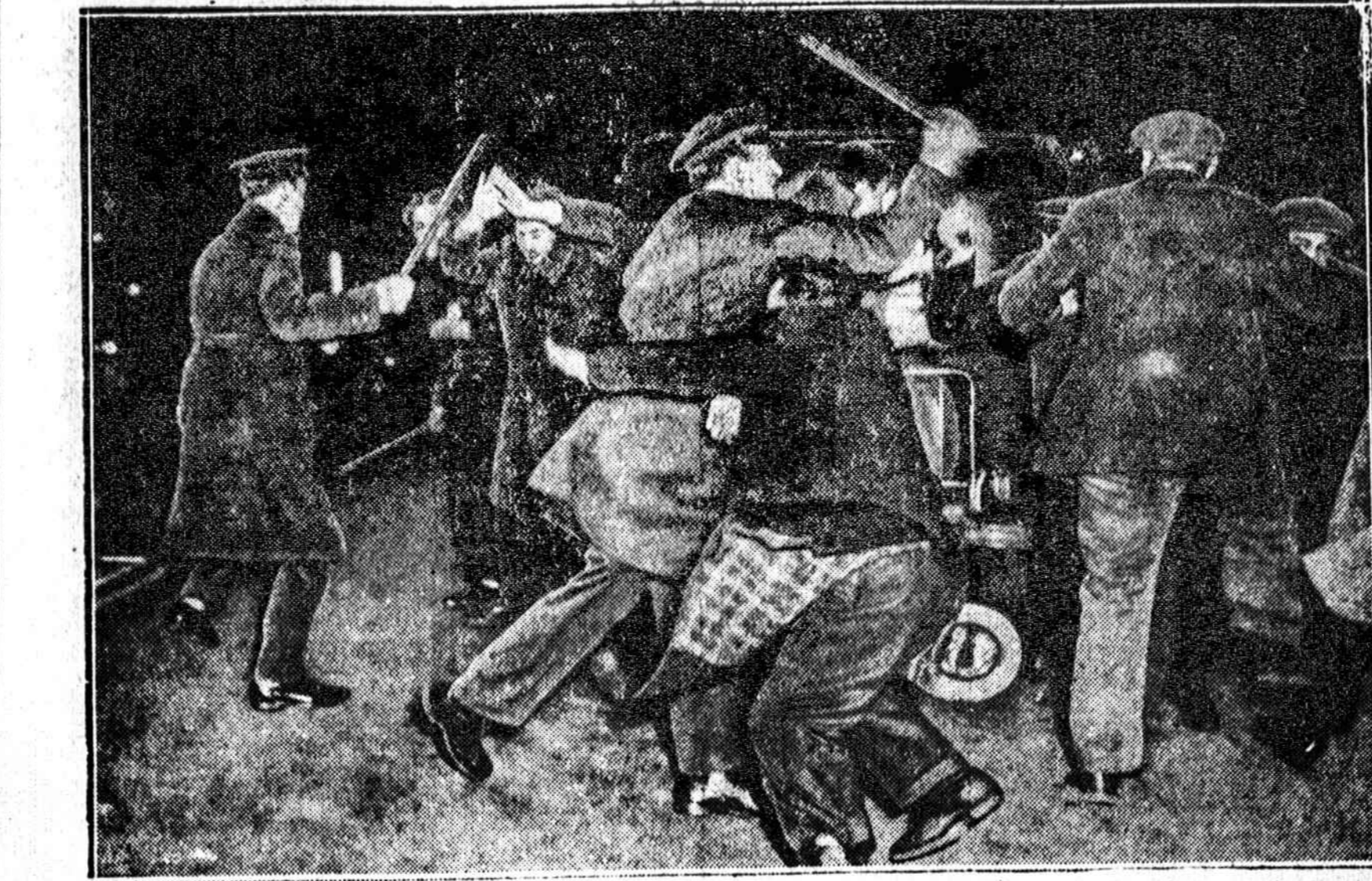
Policija vaiko komunistų demonstraciją prie išrinktojo prezidento Franklin Delano Roosevelt namų New Yorke.

Londonas. —10 metų kalė Gloucestershire farmoj, išau- ginusį daugelį šunų, kurios mė- giamiausias dalykas buvo me- džioti zuikius, susirado toli lau- kuose zuikių guštą ir parsine- šusl namo 3 zuikius, dabar juos patį augina.