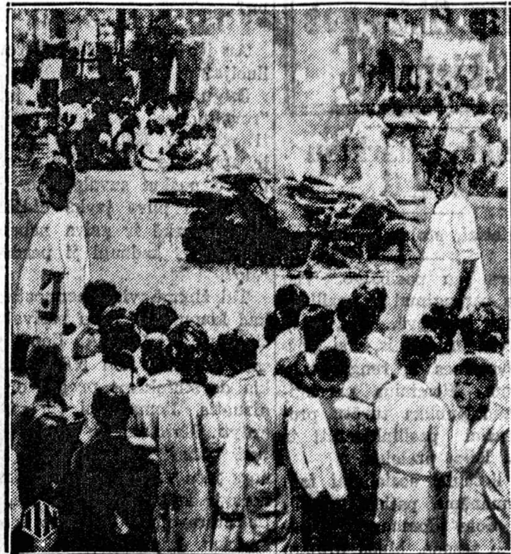
Viso pasaulio teosofų vadas, Dr. Annie Besant, ilgus metus gyveno Indijoje. Mirdama ji išreiškė pageidavimą, kad jos kūnas būtų sudegintas einant indusų apeigomis. Tas pageidavimas liko išpildytas ir jos kūnas liko sudegintas ant lauko Adyar miestely, Madras provincijoje, Indijoje. Paveikslė matyt deginamas ant lauko jos kūnas. Teosofijos sekėjų yra ir tarp lietuvių. Žymiausias lietuvių teosofas yra rašytojas ir Prūsų Lietuvos veikėjas Vyduanas.

nas, trenkė duris ir nepažvelgęs nei į dešinę, nei į kairę, nužygiavo skersai kambario tiesiai prie jo laukiančių pusryčių.