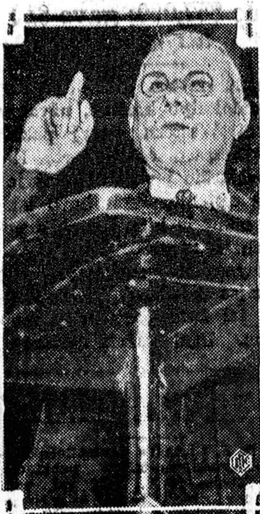
Amerikos Darbo Federacijos prezidentas William Green atidaro 53-čią metinę Federacijos konvenciją Washington, D. C.