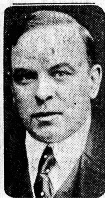
W. MacKenzie King