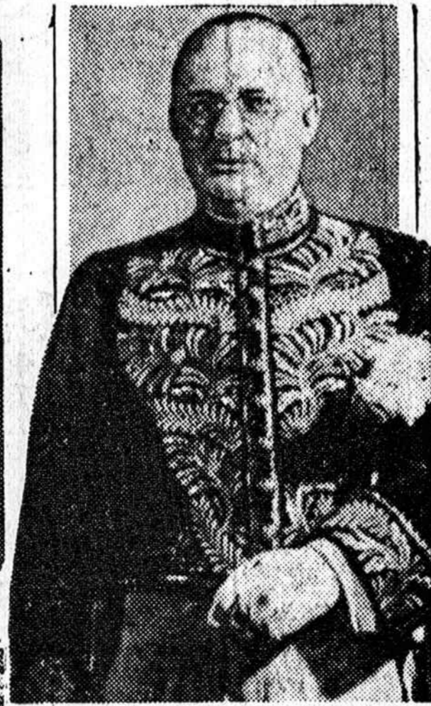
Prime Minister Bennett