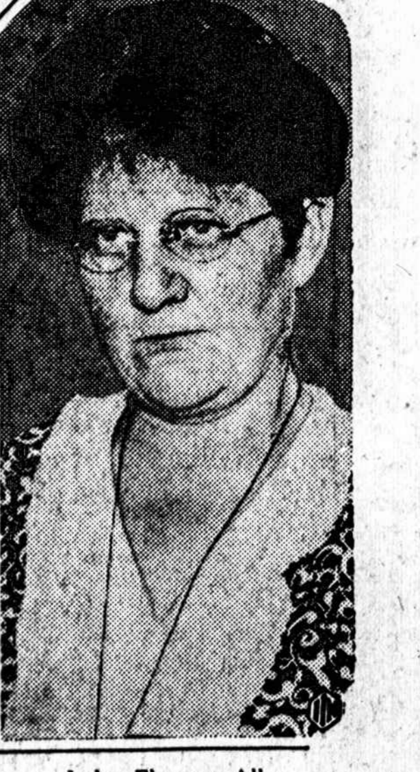
Judge Florence Allen