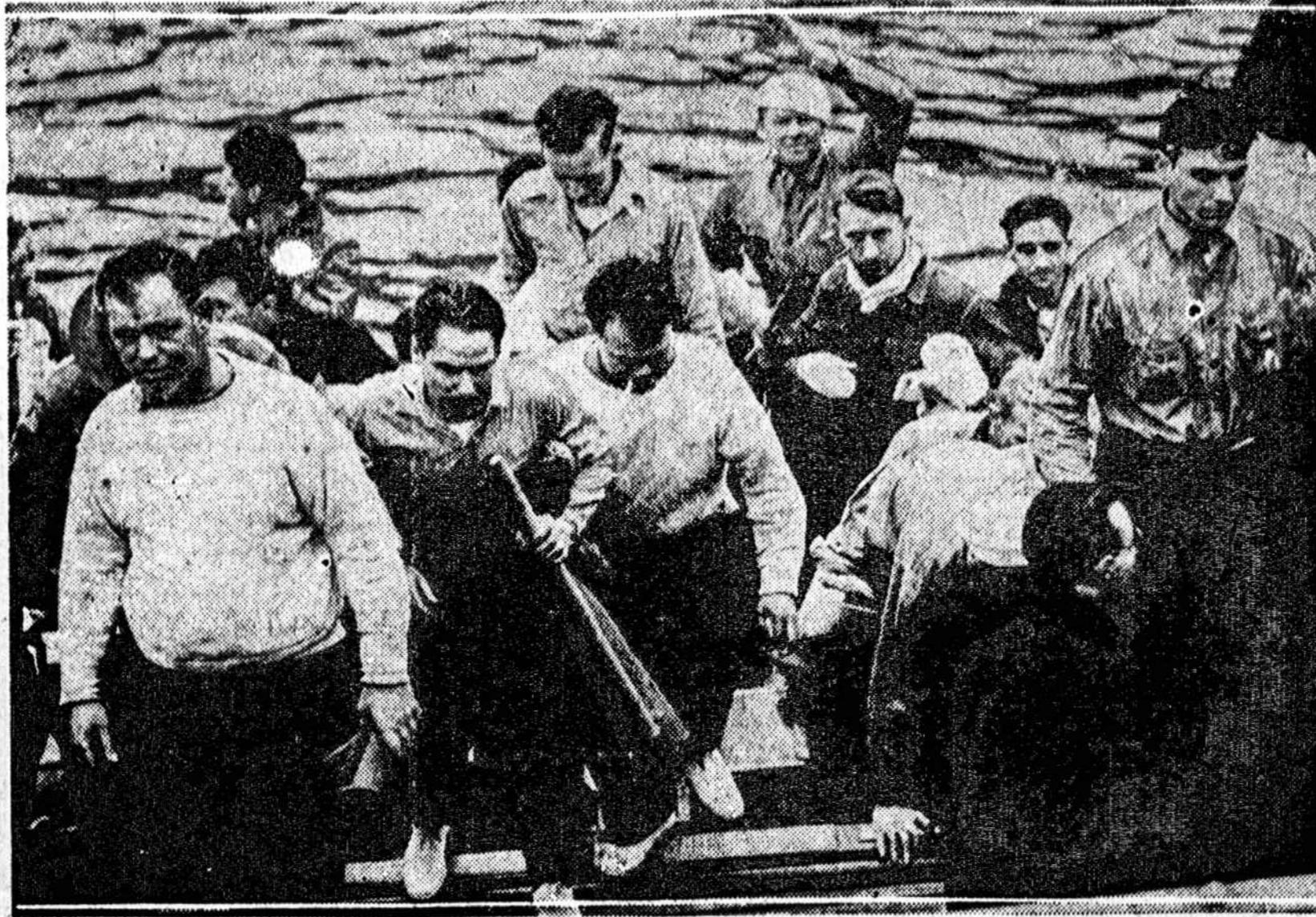
Point Sur, Cal. — U. S. dirizablio Macon įgulos nariai, kuriems pasisekė išsigelbėti. Jie išėjo į krantą dainuodami "Hail, Hail, the Gang's All Here". Bet taip nebuvo, nes dviejų įgulos narių truko.

Šokdami ir kortuodami susirinkę praleido vakarą, ir kurį kiekvėniam buvo malonu atsilankyti.—Ten buvęs.