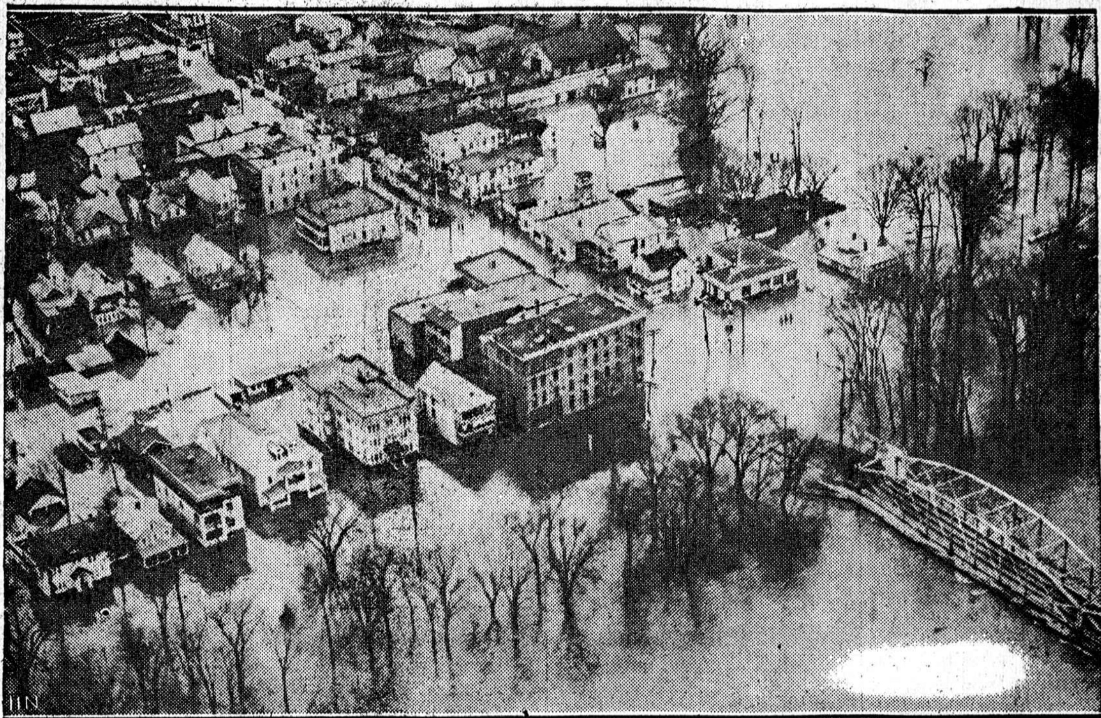
BINGHAMTON, N. Y. — Tarp kitų lietuvių kolonijų, kurios kentė nuo potvynių, buvo ir Binghamtonas. Kai Susquehanna ir Chenango upės išsiliejo iš krantų, jos nukirto ir gasą ir elektrą ir suardė geriamo vandens vandentiekius. Paveikslas pa- rodo dalį Binghamtono rezidencinio distrikto po vandeniu.

KLAIPEDA.—Paskutinėmis dienomis Panemunėje gausiau lankosi Tilžės gyventojai. Jie leidžiami čia ateiti papietauti. Valgyklos ir užkandinės kasdien gamina daug pietų. Toks pat judėjimas pagyvėjo Virbalyje ir Kybartuose, nes ir iš Eitku- nių žmonės leidžiami ateiti pie- tauti.