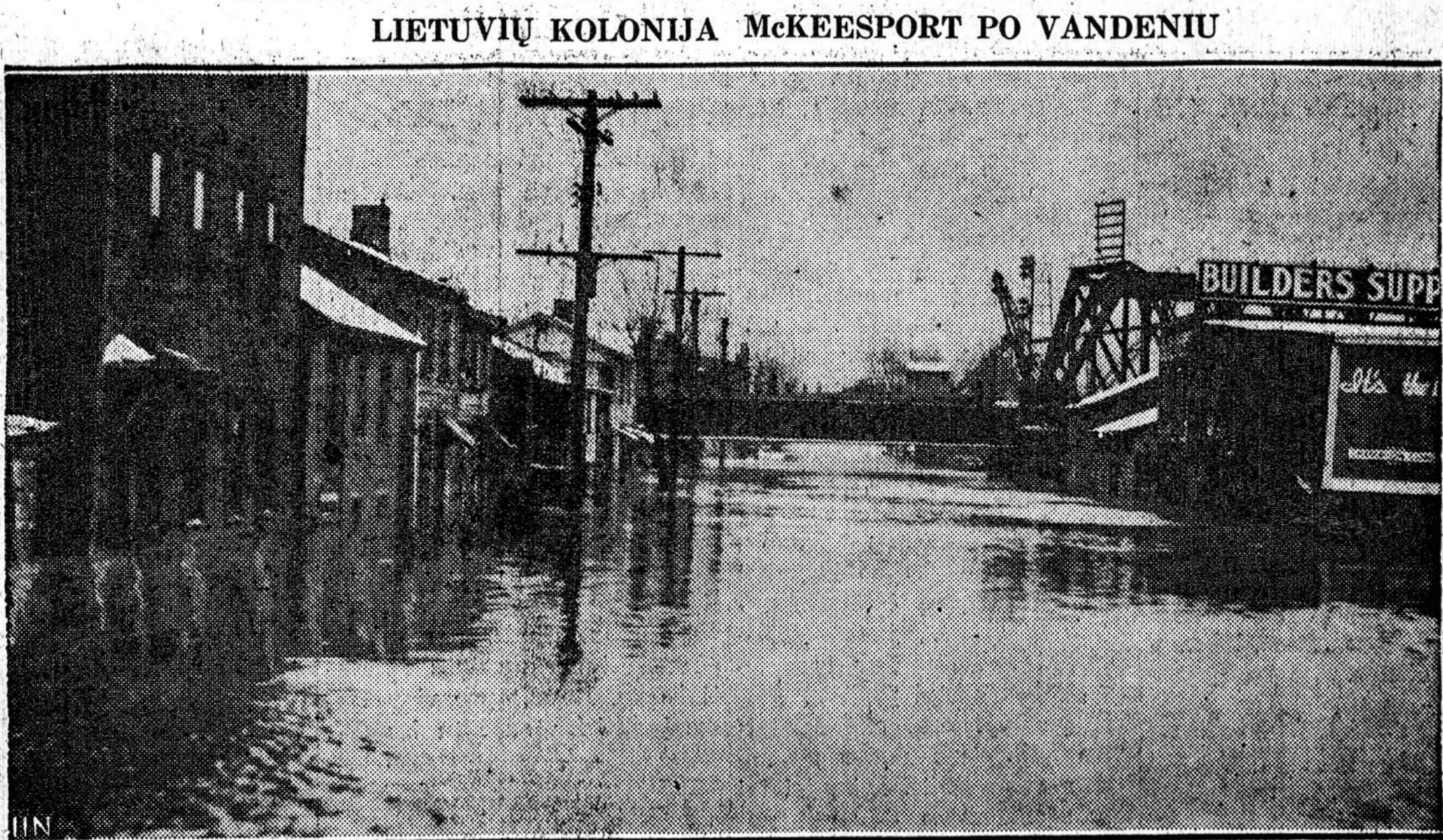
Labai skaudžiai nukentėjo potvyniuose McKeesport miestas, šale Pittsburgho. Vanduo vietomis siekė beveik antrą lubą. McKeesporte gyvena daug lietuvių.

Jis buvo paskutinis išlikęs gyvas šeimos narys. Kiti jo broliai ir šeimos nariai arba yra išžudyti, arba sėdi kalėjimuose.