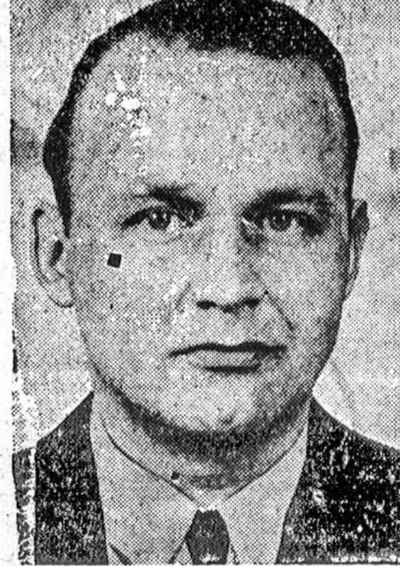
SUIMTAS — Clyde Derrick, žymus rytinių valstijų piktadaris ir vogtų automobilių pirklys, kuris buvo suimtas už pagrobimą dviejų policistų iš Johnson City, N. Y.