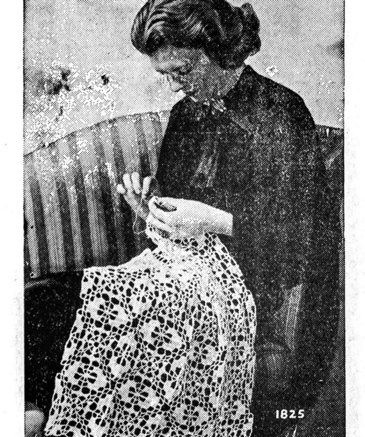
No. 1825—Iš ketvirtainių šmūtų numegstas, o paskui su siutais užklajamas komodei ar stalui.