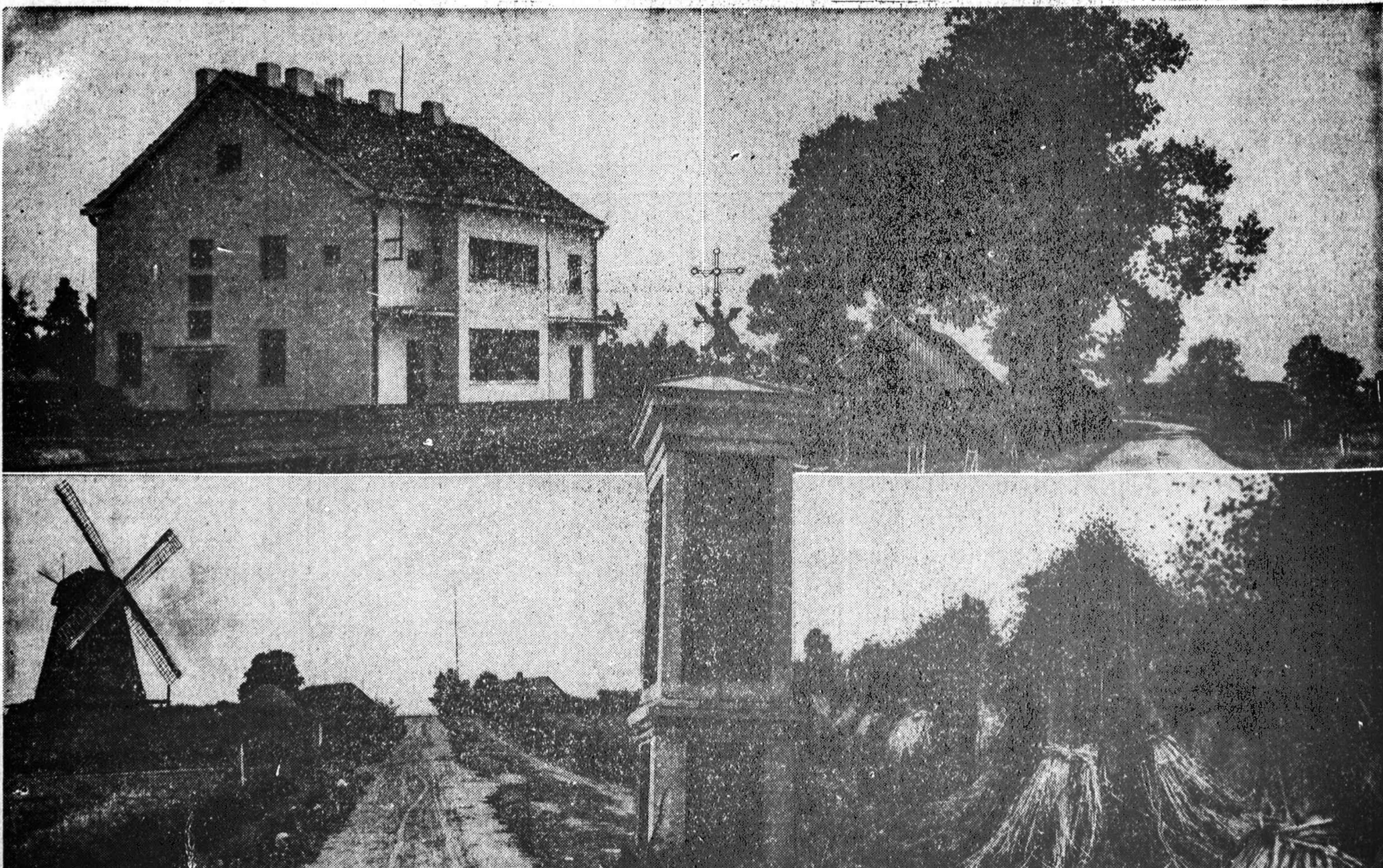
ZEMAITIJA — Kaip Zemaitija iš tiesų atrodo. Vaizdas Lazdininkų kaime Darbėnų valsč Kretingos apskrities. Viršuje kairėje—Darbėnų naujai pastatyta geležinkelių stotis, dešinėje—ukis prie kelio. Apačioje kairėje—ukį kerta vieškelis, žemaičių budingas kryžius, linų derlius.

Taip pasakė šv. Ambrozias šv. Augustinui, pareikšdamas, kad reikia prisilaikyti papročių tos vietos, kur esi. To posakio atsiradimo istorija yra maždaug tokia. Milano ir Romos vyskupų sostai savo autoriteto atžvilgiu buvo beveik lygus ir kiekviena tų krikščioniškų bendruomenių turėjo savo papročius ir taisykles. Šv. Augustinas pasakoja, kad jo motina, "atvykusi pas mane į Milaną, sužinojo, kad Milano bažnyčioje nepasnikaujama šeštadieniais, kaip kad pasnikaujama Romoje, ir ji nežinojo, kaip jai reikia pasielgti. Aš atsi-klausiau šventos atminties Ambrozo, kurs man šiaip atsakė: "Kai esi Romoje, pasnikauju šeštadieniais, kai esu Milane nepasnikauju." Taigi, ir pats taip daryk: laikykis papročių tos vietos, kurioje tenka būti."