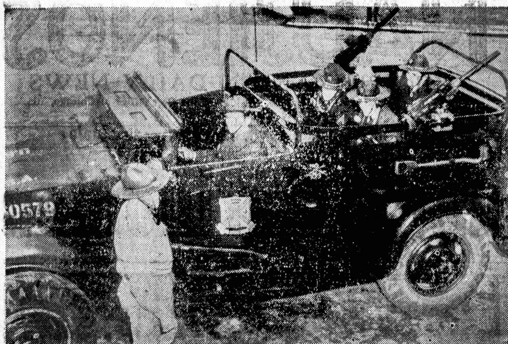
NEW ORLEANS, La. — Balsavimo metu kareiviai prižiūri tvarką.

—Aš noriu, Antanėli, tau ką pasakyti, tik bijausi, — labai nedrąsiai pradėjo Rokas.