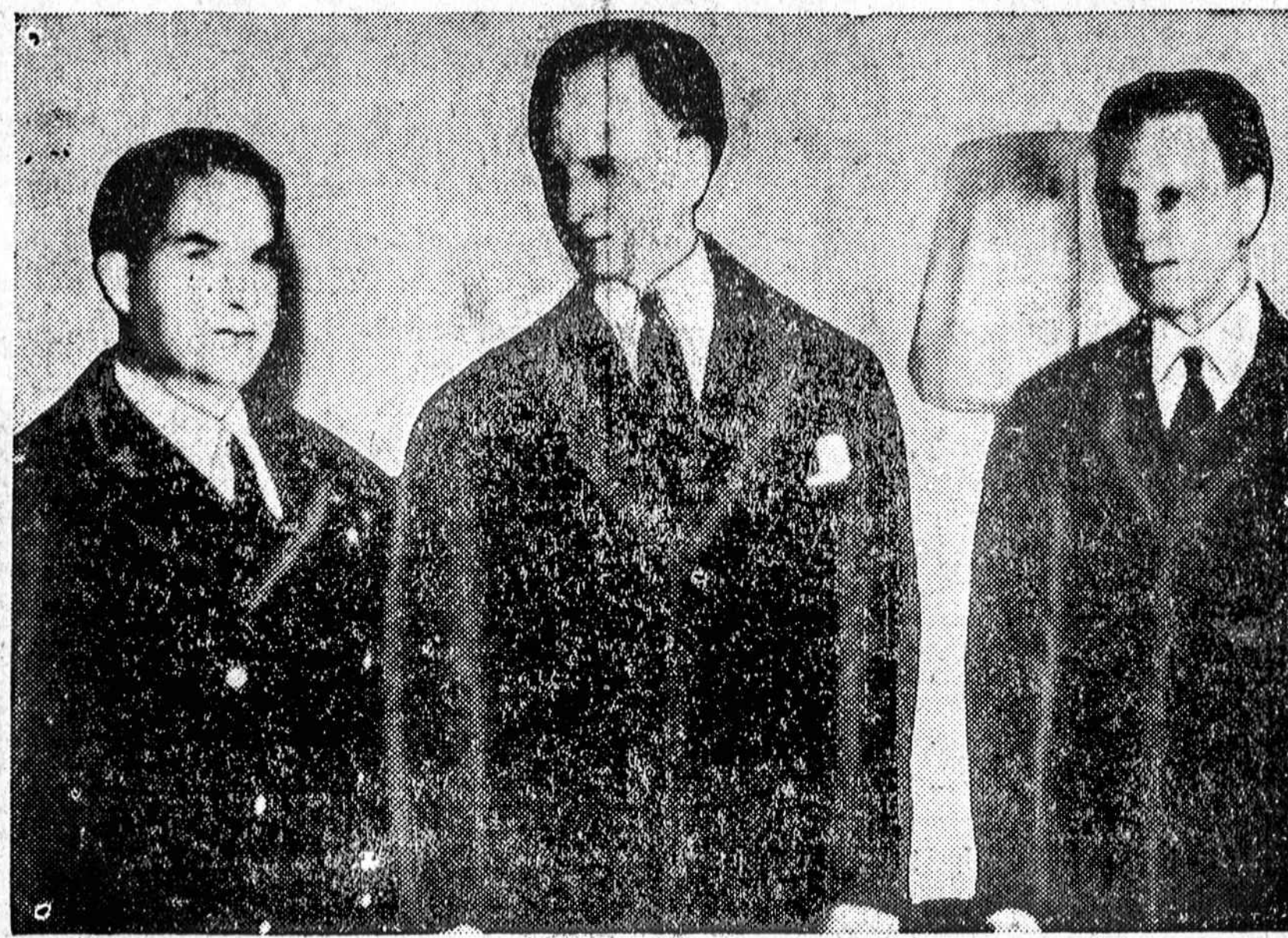
ROMA, ITALIJA.—Sumner Welles, prezidento Rooseveltto pasiuntinys (viduryje), kurį pasitinka Italijos užsienių reikalų ministras Ciano.

Francuzai ir britai esą nusitarę neleisti Hitleriui ir Staliniui daugiau įsigalėti Skandinavijoje, sako pranešimai. Nors tie pranešimai yra neoficialūs, bet į juos kreipiamas rimto dėmesio.