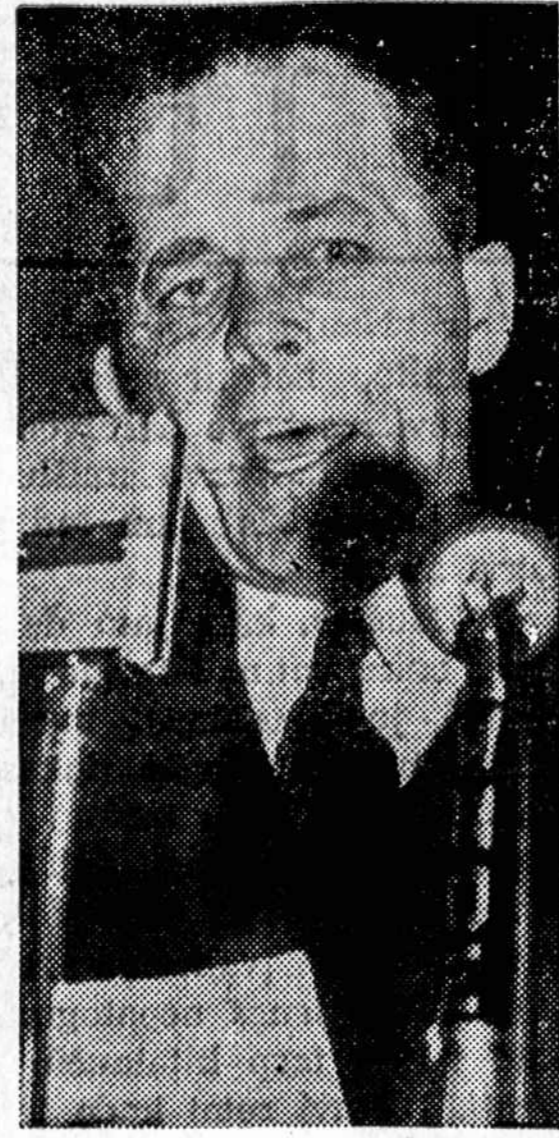
Sam Houston Jones kalba per radiją. Jis liko nominuotas į Luoisiana gubernatorių.