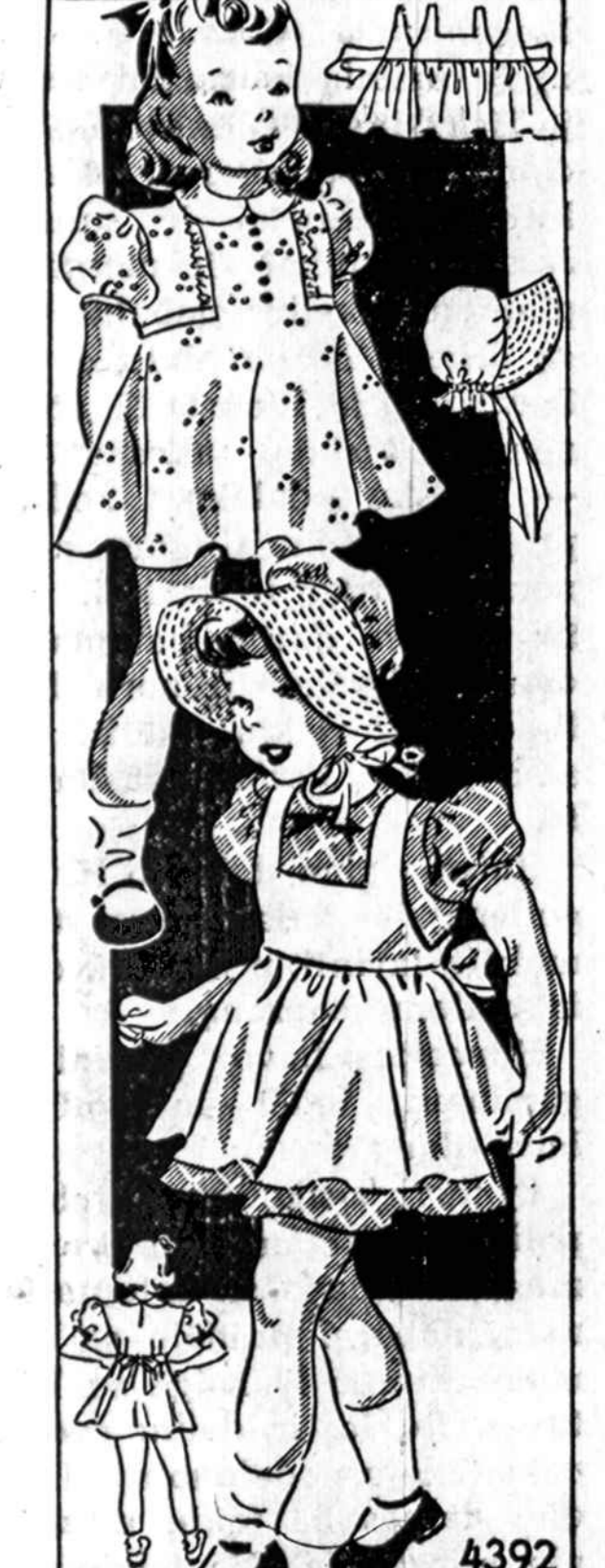
4392—Mergaitėms suknelė su prijuostu ir "Bonnet". Sukirptos mieros 2, 4, 6, 8 ir 10 metų.

Norint gauti vieną ar daugiau virš nurodytų pavyzdžių prašome iškirpti paduotą blanketę arba priduoti pavyzdžio numerį pažymėti mierą ir aiškiai parašyti savo vardą, pavardę ir adresą. Kiekvieno pavyzdžio kaina 15 centų. Galite pasiekti pinigų arba pašto ženkleliais kartu su užsakymu. Laiškus reikia adresuoti: Naujienos Pattern Dept., 1739 So. Halsted St., Chicago, Ill.