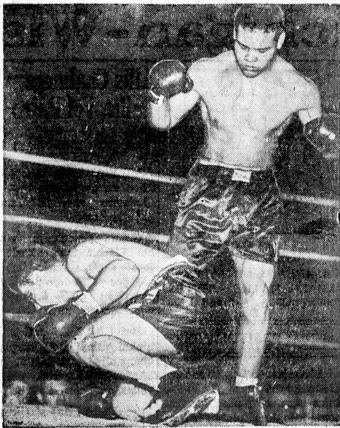
Joe Louis, pasaulinis bokso sunkaus svorio čempionas, antradienio vakare slusitiko su Gus Dorazio Philadelphia mieste apgyimui savo vainiko ir oponentą nokautu paguldė antrajam raunde.