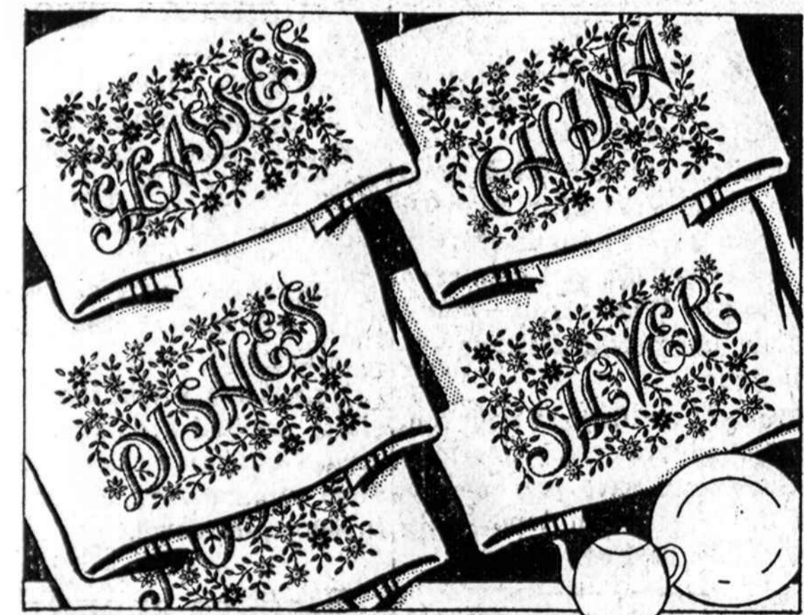
KITCHEN TOWELS PATTERN 2771 No. 2771 — Išsiuvinėjimai virtuvės abrusėliams

NAUJIENOS NEEDLECRAFT DEPT. No. 2771 1739 So. Halsted St., Chicago Ill.