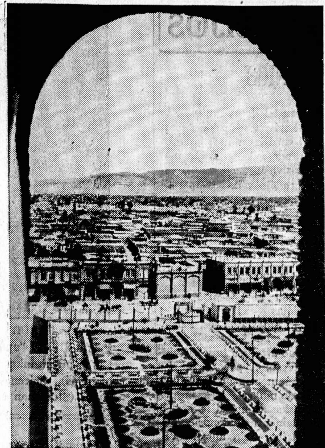
Iš lėktuvo padaryta Tabrizo nuotrauka. Šis miestas randasi šiaurinėje Irano dalyje. Iš Kaukazo įsiveržusi sovietų kariuomenė deda pastangas paimti šį persų miestą.