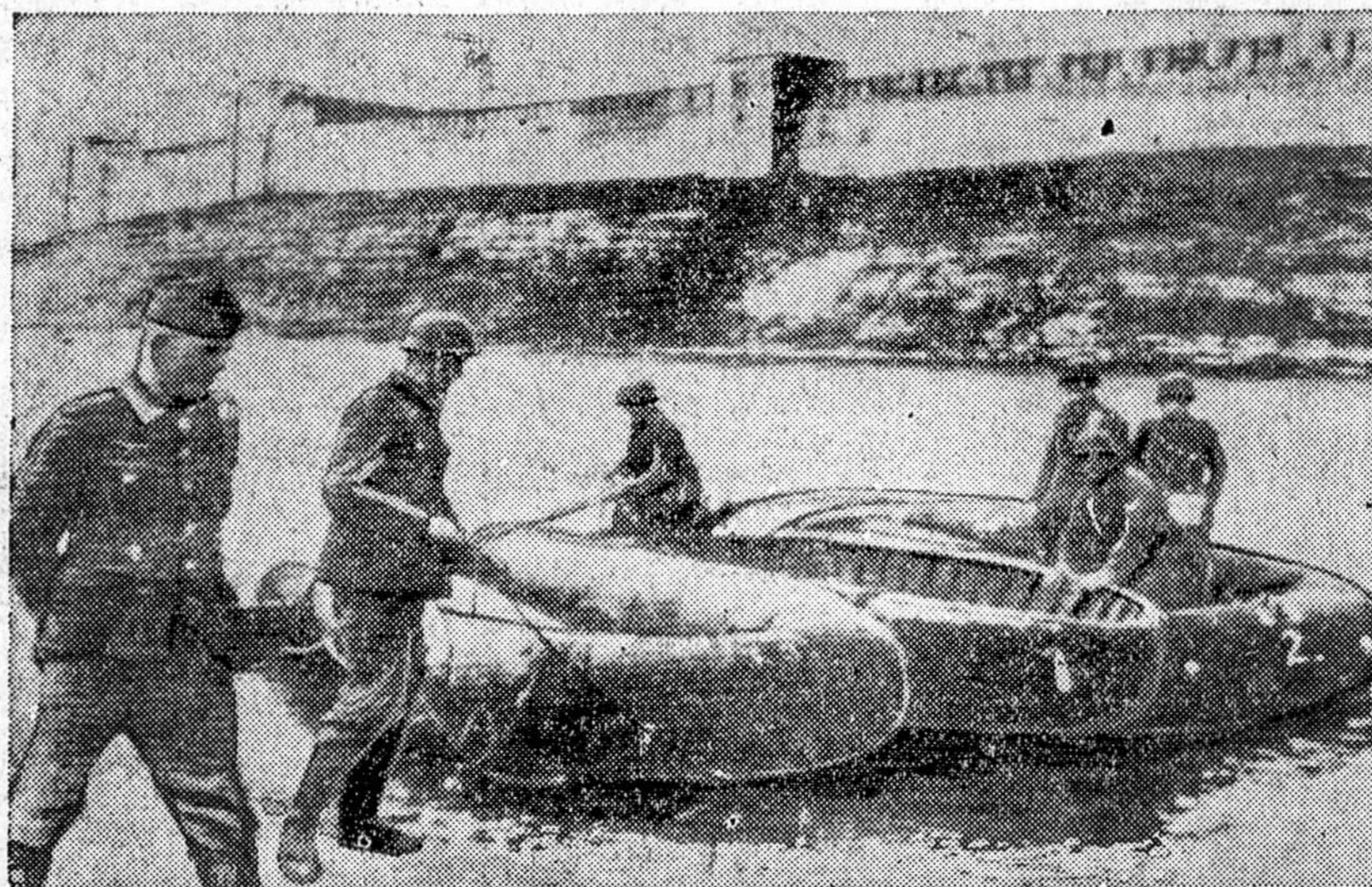
Vokiečių kareiviai žengia per Narvos upę, kuri randasi apie 100 mylių atstumoje nuo Leningrado. Paveikslas tapo perduotas iš Berlyno per radiją. Pagrinde matosi Narvos tvirtovės, kurias vokiečių kariuomenė neseniai paėmė.