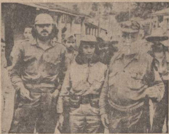
Kubos sukilėlių armijos trys nariai Fomeno miesto gatvėje. Tę mieste, kuris yra Las Villas provincijoje, sukilėliai prieš porą dienų užėmė. Sukilėlių vadovą yra Fidel Castro.