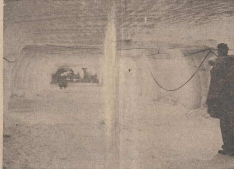
Armijos inžinieriai, kariai ir mokslininkai pravedė 1,500 pėdų tunelį leduose netoli Tuto stovyklos Arktika. Tos rūšies tuneliai, reikalingi esant, galėtų būti panaudoti sandėliams, transportacijai.

Kitame komentare ("Der aktuelle Osten", Bonn 42/43 nr.) ryšium su tais klausimais pastebima: "Jei apie 50 milijonų dirbančiųjų, arba apie pusę visų darbo jėgų, dirba žemės ūkyje ir nepajėgia pakankamai išmaitinti nė antrosios dirbančiųjų