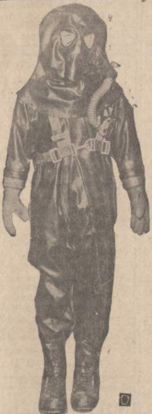
This missile is dressed for a date with the moon. His En-Jay Butyl rubber suit is impervious to liquid oxygen, hydrogen peroxide, fuming nitric acid and other chemical rocket fuels. The suit is made of a combination of cotton-fabric base and resin-modified butyl. This newest of Space Age fashions was developed by the Army Quartermaster Research and Engineering Command to protect missile-servicing crews on the launching pads.