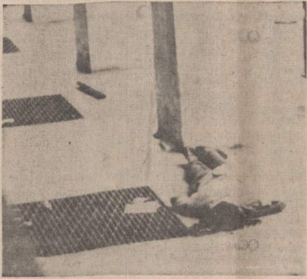
Per trumpą suirutę laikotarpį nuo prezidento Batista pabėgimo iki sukilėlių išsivimo, Kubos sostinėje Havanoje plėšikautojų gaujos buvo pradėję plėsti ir naikinti gyventojų turta. Matomas vienas policijos nušautas plėšikautojas prie Savilla Biltmore viešbučio.