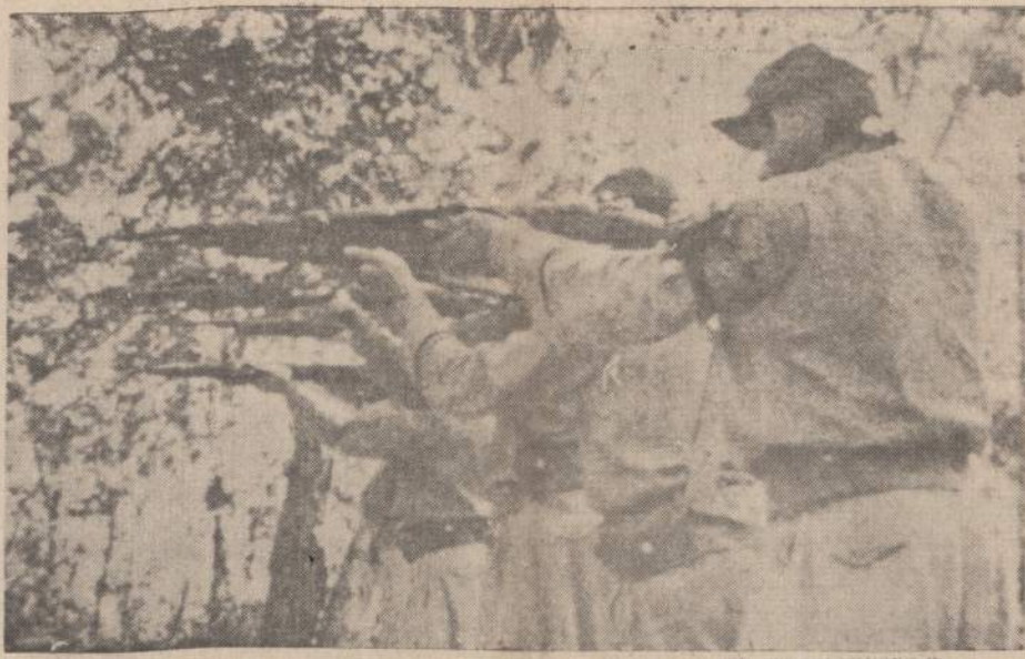
Kubos revoliucionierių dalinys taiko šautuvus į neteisai mirti viena iš pačių vyrų, pasidavusių priešui ir pasidūrisį snipu išdaviku. Revoliucionierių žiniomis teismas ir ekzekucija įvykė kur tai centriniėje Kuboje.

Po dviejų triukšmingų sutikimų, prie Midway aerodromo, ir Conrad Hilton viešbučio, Anastas Mikojanas viešbutyje buvo užpultas spaudos reporterių, kurie be eilės kitokių plokštumų paklausė, ar Mikojanas tikis, kad kapitalizmas savaime nuvys ir sunyks ir kad Jungtinės Valstybės pavirs "so-