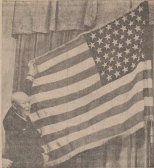
Prezidentas Eisenhoweris išskleidžia naują Amerikos vėliavą: septynis kartus po septynis žvaigždes, tai fikio žvaigždžių, kiek pasidarė valstybių, priėmus Aliaską į Uniją, kaip 49 valstybę.

Kaltinamasis nusivelka savo švarko rankovę, atsaugoją diržus, įteikia medinę rankų protezę policininkui ir patenkintas eina pro duris.