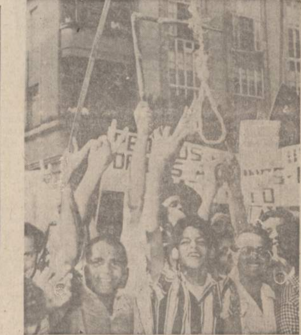
Havanoje, Kubos sostinėje, apie pusės milijono minia rėikafavo mirius partijos vadovams, kurių dar apie 600 laukia revoliucionių teismo. Dalis minios iškėlusi rodo kartuvų kilpą...

Streikas ir be jų atšaukimo buvo iš didžiausios šalies palaufatas, kai vyriausybė mobilizavo susisiekimo, transporto ir kitų svarbių įmonių darbininkus, tarnautojus ir jiems pritaikė karinės tvarkos įstatymus. Trejetas šimtų streiko agitatorių ir organizatorių buvo suimti.