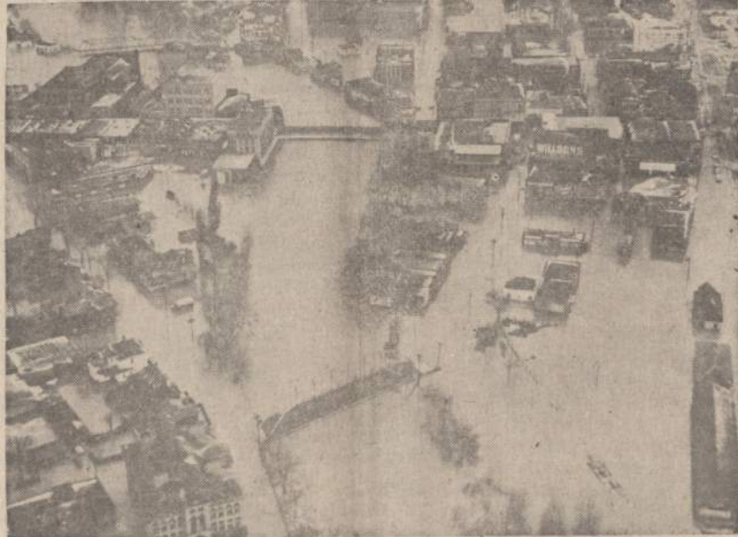
Nuo didelių liūčių patvinsui Shenango upė visiškai apėmė Sharon, Pa., miesto biznio centrą, padarydama milijonus nuostolių.

Pagal senąją nuomos sutartį JAV moka Panamai $2 mil. metinės nuomos.