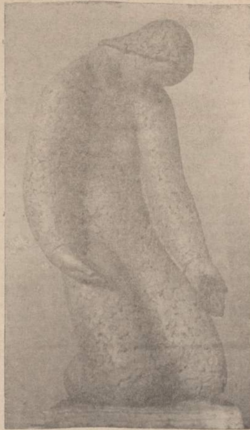
J. T. ZIKARAS — Skulptūra

Rusų paroda Karališkoje Akademijoje Londone baigsis š. m. kovo 1 d. 1960 metais angliai