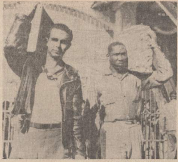
Buve Batistos šalininkai, paleisti į laisvę, aplieidžia La Cabana katedrą prie Havanos, nešdami savo reikmenis. Tokių kalinių buvo paleisti apie 100.

PATRIA GIFT PARCEL CO. 3741 W. 26th St. CR 7-2126 Skyrius: 3305 So. Halsted St. LAFayette 3-2021