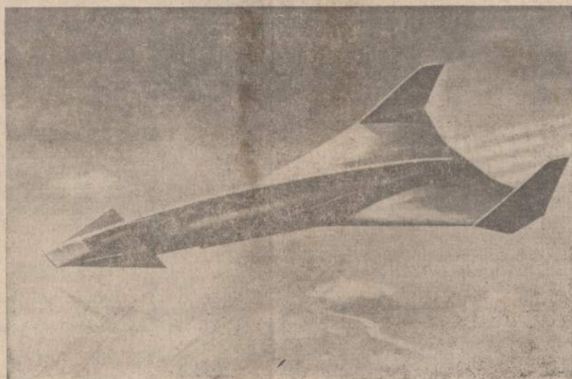
Dailininko braižinys erdvėlaivio, koks, jo įsivaizdavimu, bus vardomas skristi į planetas. Tokių ir dar fantastiškesnių braižinių labai daug gauna General Dynamics Corp., San Diego, California.

Giedra; d. 20, naktį 8. Saulė tek. 7:05, leidžiasi 5:05