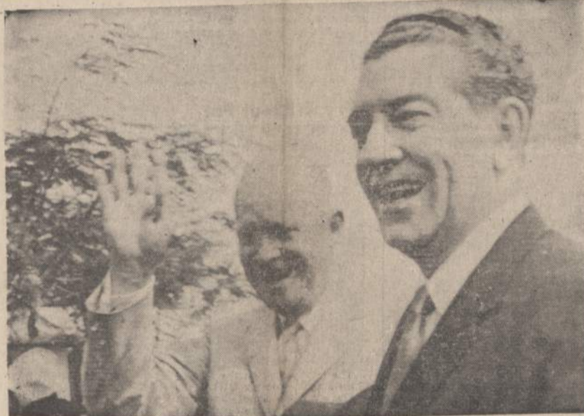
Presidentas Eisenhower su Meksikos prezidentu Lopez Mateos Meksikos aerodrome Acapulco, kur JAV prezidentas atskrido vizituoti Meksikos prezidentą.