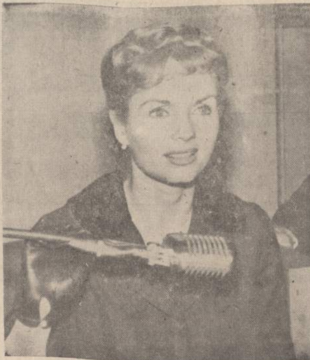
Aktorė Debbie Reynolds skrybiu teisme Los Angeles liudija prieš Eddie Fisher, pareikšdama "Mano vyras domisi kita moterimi". Teismas Debbie atskyrė nuo Eddie, ir Debbie be to gaus iš Eddie apie milijoną dolerių pamokėjimo.

Antrasis tomas kainuoja 7.00 doleriai. "N." Adm.