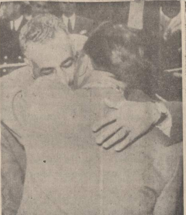
Egipto prez. Gamal Abdel Nasser (kairėje) labai šiltai pasitinka Jugoslavijos prez. Tito, kuris sustojo Suez, grįždamas iš Sudano.