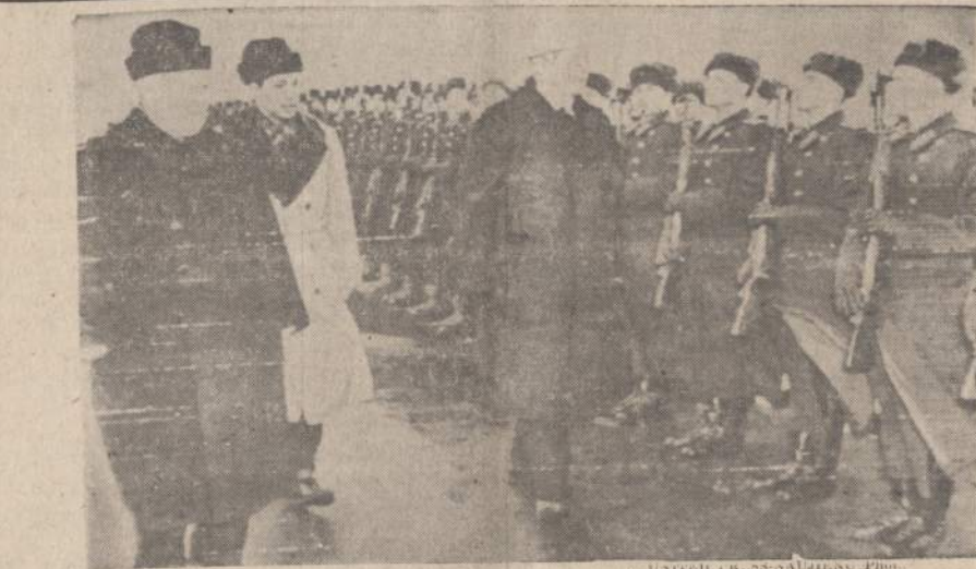
Anglijos premjeras Harold Macmillan (dešinėje) dėvi rusiška balto kailio kepurę. Maskvos aerodrome jis stebi garbės sargyba. Kairėje yra sovietų premjeras Chruščiovas.

Boris Pasternak be to paaiškino, kad keletas Vakarų Europos kultūrininkų be pagrindo skelbia žinias apie jo sutikimą atvažiuoti į Angliją ir Ameriką su paskaitomis apie rusų nūdienę literatūrą. Jis kvietimo nepriėmė ir nesirodė važiuoti.