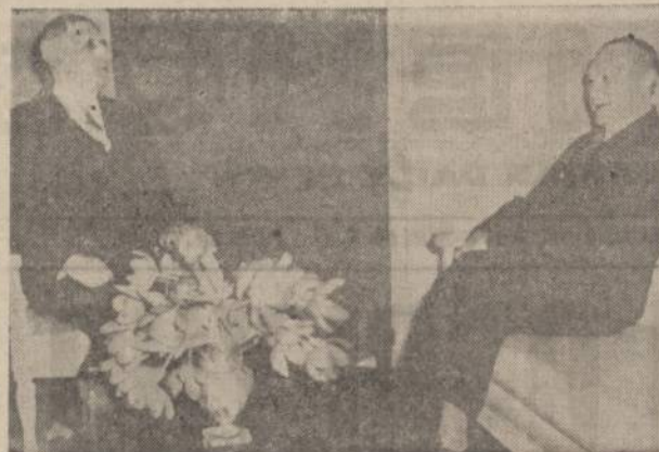
Prancūzijos prezidentas Charles De Gaulle ir Vakarų Vokietijos premjeras Konrad Adenauer susitinka Paryžiuje. Juodu griežtai laikosi, kad Maskvai nebūtų daugiau daromos nuolaidos.

116 asmenų pernai Chicagoje gavo specialią terapiją, kurią jiems parūpino Chicago Easter Seal Society. Šimtai kitų luošų ir paralyzuotų laukia tokios terapijos. Jūs galite jiems padėti, remdami Velykų ženklelių pardavimą.