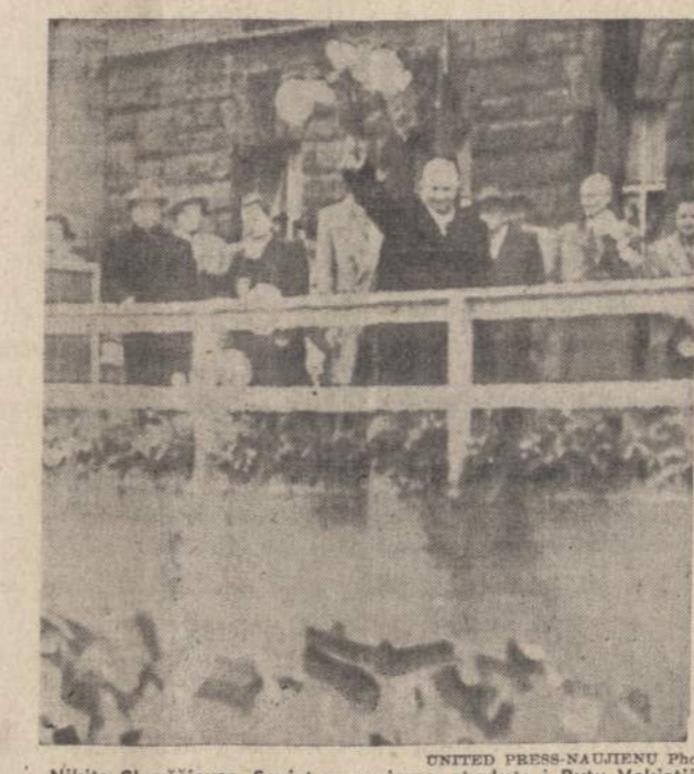
Nikita Chruščiovas, Sovietų premjeras, atvyksta į Rytų Vokietiją.

● Chicago Easter Seal draugija skolina reikalingiems vaikams ir žmonėms ortopedinius prietaisus ir įrankius. Praeitais metais 878 tokie ortopediniai prietaisai buvo paskolinti luošioms vaikams, paaugliams ir suaugusiems. Tam reikalinga lėšų, o tokias lėšas stengiasi sukelti draugija per Velykų ženklėlius.