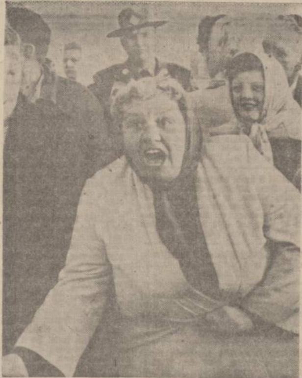
AUDEJŲ STREIKAS. — Viena iš streikuojančių darbininkių iš Henderson, N. C., tekstilės fabriku plusta valstybės policininkus, atsistutus ginti streikuojančių nuo streikininkų. Streikas prasidėjo prieš 4 mėnesius.