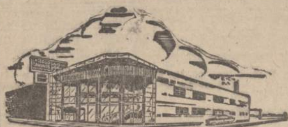
Chicago Savings and Loan naujoji įstaiga

ATDARA: Pirmadienį 12 iki 8, antradienį 9 iki 4, trečiadienį uždaryta visą dieną, Ketvirtadienį ir penktadienį 9 iki 8. Seštadienį 9 iki 12:30 val.