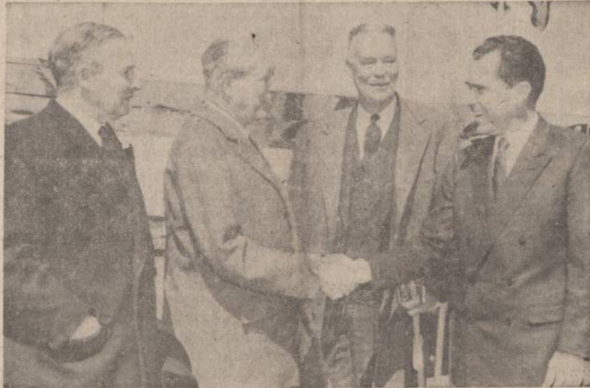
Viceprezidentas Richard Nixon (dešinėje) pasitinka aerodrome Anglijos ministrį pirmininką Harold Macmillan. Tarp judvieju valstybes pasiretorius Christian Herter. Užpakalyje Macmillan jo užsienio reikalų ministris Selwyn Lloyd.

Mass. Technologijos Instituto mokslininkai, kurie pirmieji užmezgė "ryšį" su Venera, padarė išvadą, kad universas nėra jau toks didelis, kaip kad būdavo manoma.