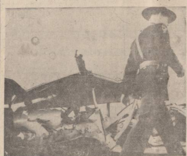
Automobilis, kuriame traukiny už 10 mylių nuo Dayton, Ohio, užmūšė dešimtį žmonių, aštuonias skautes ir dvi jų motinas.