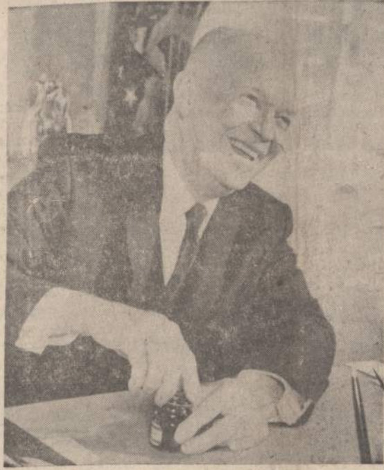
Prez. Eisenhower uždaro rašalinę, ka tik pasirašęs bilij, kuriuo Havajai priimami į Uniją penkiasdešimtajai valstybe.