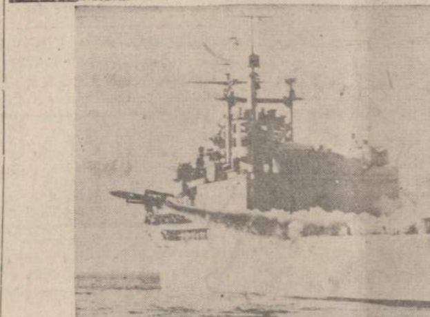
Jungtinės Valstybės praeiti rudenį išsėvė tris branduolinius sviedinius į kokių 300 mylių aukštį. Bandymai buvo labai slapti, skirti moksliniams ir militariniams tikslams. Sviediniai išsėvė nuo 15,000 tonų Norton Sound laivo denio Atlanto vandenyno pietinėje dalyje.