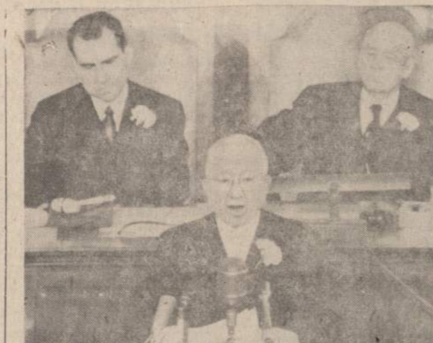
Airijos prez. Sean T. O'Kelly kalba prieš bendrą kongreso posėdį, kuriame jis buvo labai šilniai priimtas. Už jo sėdi viceprezidentas Nixon ir atstovų buro pirmininkas Sam Rayburn.