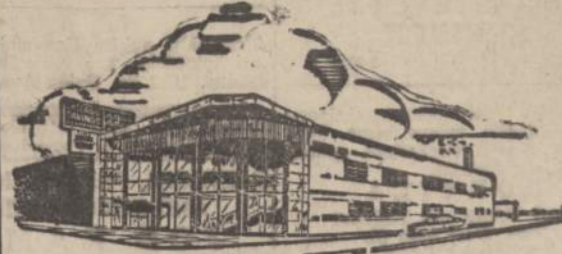
Chicago Savings and Loan naujoji įstaiga

ATDARA: Pirmadienį 12 iki 8, antradienį 9 iki 4, trečiadienį uždaryta visą dieną, Ketvirtadienį ir penktadienį 9 iki 8. Šeštadienį 9 iki 12:30 val.