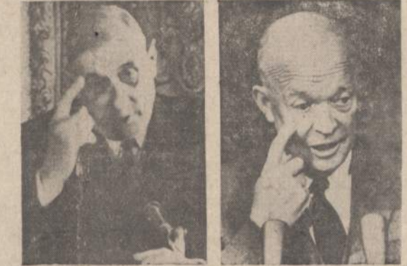
Tuo pačiu metu kalbėjo Berlyno klausimu Washingtono ir Paryžiaus prezidentas Eisenhower ir prancūzų prezidentas Charles De Gaulle fotografų pagauti panašioje pozėje.