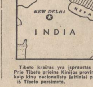
Tibeto kraštas yra išsprausas kelnuose tarp Indijos ir Kinijos. Prie Tibeto prieina Kinijos provincijos Chinghai ir Sikiang, į kurias, kaip kinų nacionalistų šaltiniai praneša, sukilimas prieš komunistus iš Tibeto persimetė.

Senatorius Frank Church (d. Ida.) pasakė: "Tai begėdiškas nemoralizmo rodymas, sąmonės išnaudojimas visuomenės jautriais nuotaikais, išnaudojimas spalvuotųjų piliečių..."