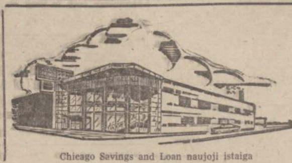
Chicago Savings and Loan naujoji istaiga