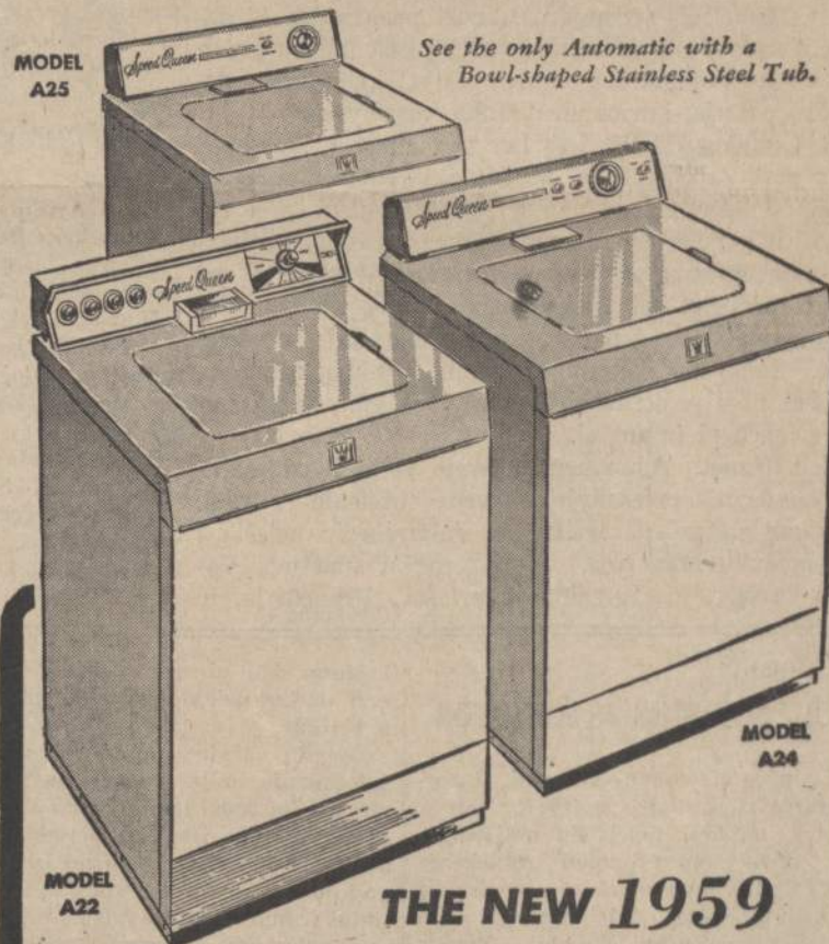
See the only Automatic with a Bowl-shaped Stainless Steel Tub.