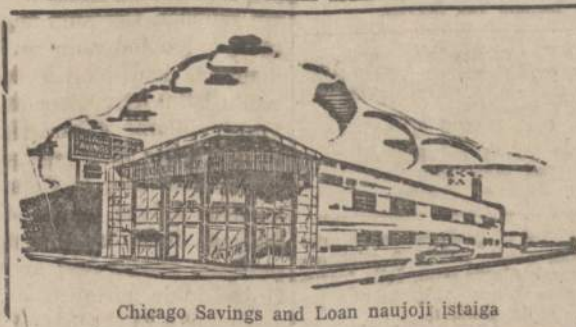
Chicago Savings and Loan naujoji istaiga