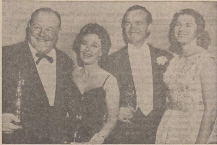
Oskaro laimėtojai. Keturi pirmieji Academy Award laimėtojai Hollywoode: iš kairės Burl Ives, geriausias aktorius filme "Didelis kraštas"; Susan Hayward, geriausia aktorė filme "Aš noriu gyventi"; David Niven, geriausias aktorius filme "Atskiri stalai" ir Ingrid Bergman, atstovaujanti geriausia, dovaną laimėjusį filmą "Gigi".

Gyvenimas negali būti lyg pašėlusios srovės kaskadomis krintanti per kalnų uolas, bet taip pat negali prilygti sustovėjusiam, dumbliams apaugusiam, kūdros vandeniui. Vertingas gyvenimas, pasinaudojant L. Tolstojaus išsireikškimu apie žmogaus sielą, yra lyg "...galingos upės paviršius...", kartais drumstas, pu-