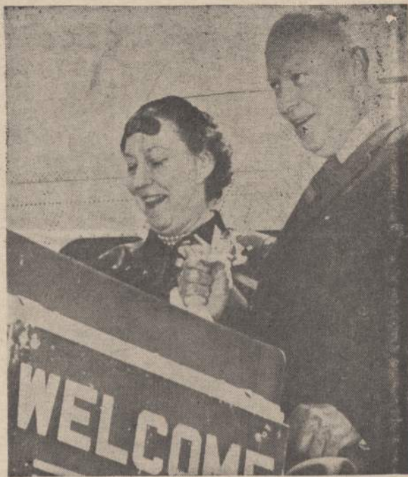
Prezidentas Eisenhoweris daktarų patarimu atvyko į Augusta, Ga. paostogauti.

Stendhalio aistra neina tačiau iki galo. Pagal jį "per daug aistringa širdis nejaučia daugelio dalykų", ir jis prieina išvadą, kad "per didelis jausmingumas kliūdo daryti sprendimus". Ideologai kaip Cabanis, Destutt de Tracy, Volney jį išmokė neiti Rousseau keliu iki galo. Kaip vė-