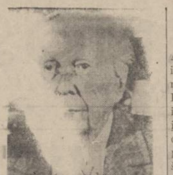
Frank Lloyd Wright, išgarsėjęs viename pasaulyje architektas, mirė po operacijos Phoenix (Ariz.) ligoninėje. Jis buvo 89 metų amžiaus.

Persirengiau į švaresnę uniformą ir nuvykau į Rockfordą (aš turėjau dvi uniformas — viena buvo armijos, o antra buvau pirkęs už savo pinigų. Ši buvo daug geresnė medžiagos ir ją vilkėdavau tik vykdamas į miestą). Pirmadienio rytą po pusryčių, kai čjau pro ofisą, kapitonas pamojo užėiti. — Ką tu veiki Rockforde antkampio? (jis paminėjo gatvių sankryžą). Juk tu leidimė neturėjai? — A-a, pamaniau, jeigu seržantas jam pasakė, tai aš galii