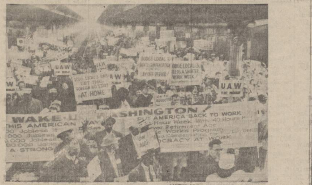
Union gatėinkelio stotis Washingtono (D. C.), kur iš visos Amerikos suvažiavo savo rūšies "dele-gatė", kad galėtų dalyvauti "nedarbo masiniam mitingui" ir demonstracijoj.