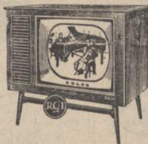
THE MARK SERIES TOWNSEND. 260 sq. in. picture. Finishes: genuine walnut or oak veneer and solid. 21CD890.

SEE all the wonderful new Color TV models today. Arrange for a demonstration—either in the store or in your home.