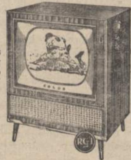
THE MARK SERIES ANDERSON. 260 sq. in. viewable area. 3 speakers. Available in 3 finishes. 21CD886.

Ask about the RCA Factory Service, available to RCA Victor set owners exclusively.