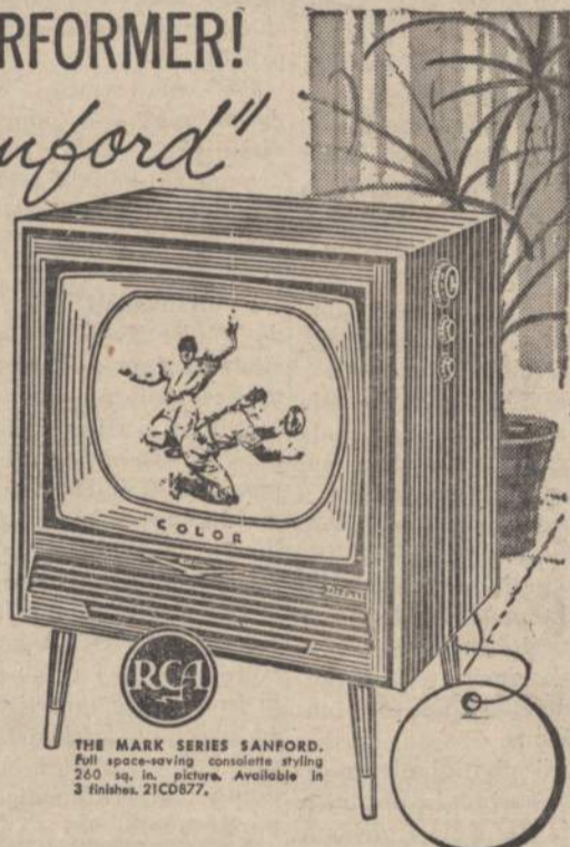
THE MARK SERIES SANFORD. Full space-saving console styling. 260 sq. in. picture. Available in 3 finishes. 21CD877.

TENS OF THOUSANDS of happy owners are thrilling to Color TV every night. See TV as it's meant to be seen.