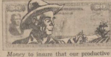
Money to insure that our productive power will thrive and grow. . . .