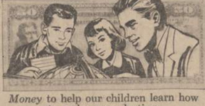
Money to help our children learn how to make peace lasting.

Yes, peace costs money. Money for research and schools and military preparedness. Money saved by individuals to keep our economy strong. Money saved by you. You and your family can be the strongest force of all for peace. Every Savings Bond you buy helps America keep peace in this troubled world. Are you buying as many as you might?