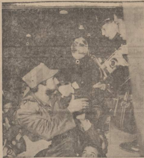
New Jorko policininkas geležinkelio stotyje saugoja Kubos premjerą Fidel Castro, kurio pasitikti susirinko tūkstančiai žmonių.