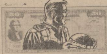
It takes money to keep our jet pilots up there patrolling the skies. . . .