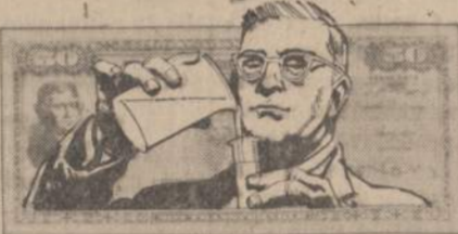
Money to let our scientists continue their search for answers. . . .