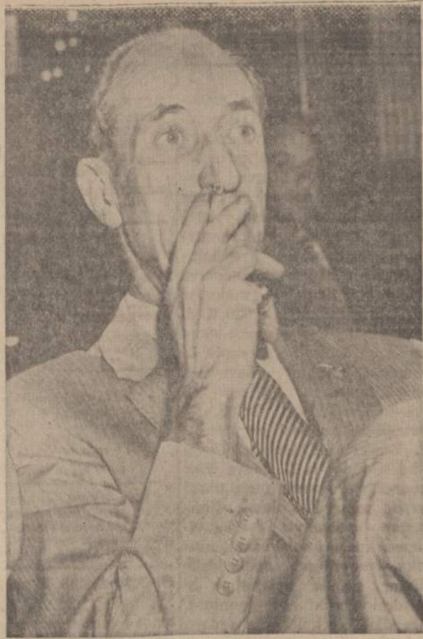
Harry Bridges, tarptautinės jūrinių uniųs prezidentas, kas groso neamerikinės veiklos tyrinėjimo komitetui "pirmą kartą savo gyvenime" atsiskė pasakyti, ar jis priklauso komunistų partijai, pasiremdamas penktuojų konstitucijos amendmentu.