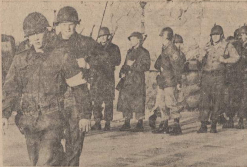
Nacionalės gvardijos kariai stovi prie Deer Lodge valst. kalėjimo Montanoje, kur buvo sėkmingai likviduotas kalinių maištas. Visi kalinių pasigrobiti įkaitai buvo išvaduoti, o 2 maišto vadai nužudė.

Lietuvių Fronto Bičiulių Los Angeles vadovybė ateinančią sekmadienį, balandžio 26 d., čia rengia viešas diskusijas apie lietuviškąją spaudą ir literatūrą. Įvadinus pranešimus pada-