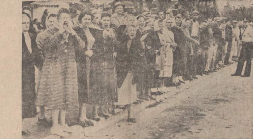
HENDERSON, N. C. — Nors tekstilės unijos darbininkai nubalsavo streika baigti, bet neramumai nepasibaigė. Pasirodė, kad streiko metu buvo pasamdytas nemažas skaičius darbininkų, kurie unijai nepriklauso. Kai streikininkai grįžo į darbą, tai gerokas jų skaičius patyrė, kad jų vietos jau yra užimtos. Prie dirbtuvės susirinko žmonių minia, kuri buvo nusistatčiusi prieš unijai nepriklausiančius darbininkus. Pralaidę nakį dirbtuvėje, tie darbininkai turėjo šauktis apsaugos.

Aš klausia progorių apie mėnulio raketą greitą proble-