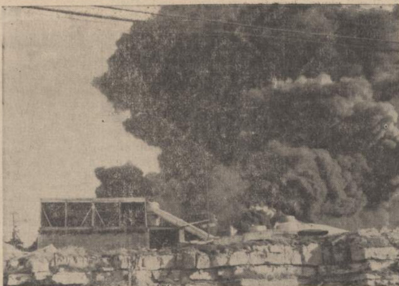
Didelė eksplozija Thompson-Hayward chemiškose dirbtuvėse Kansas City, kur sprogo 3,000 galionų piktžolėms naikinti skysčio pilnas tankas. Trys žmonės žuvo ir 5 sužeisti.

Vadinamieji "kultūros kenkėjai" be skausmingo priešinimosi, savanoriškai pasitraukė iš turėtų pozicijų, kad galėtų sėkmingai reikšti deklaraciją pasirašiusieji. Jie klusniai įvykdė 60-ties paskelbtą deklaraciją. Dabar jie reikiąsi šeimyninė aplinkumoje ir vakarais stebi televiziją, o savaitgaliais rūpestingai pernskaito banko knygele. Ir dabar jau nedaug atirasime tokių užsilikėlių, kurie nuosmū-