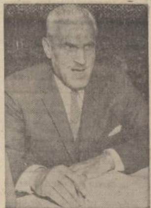
Dr. Arthur H. Compton, Noberio premijos fizikas, liudija Senato konstitucinių teisių komiteto posėdyje Washingtono, ryšiu su tuo, ar perdidelis pasilptingumas nenkenkia Amerikos mokslo progresui.