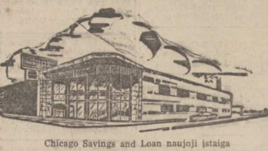
Chicago Savings and Loan naujoji įstaiga