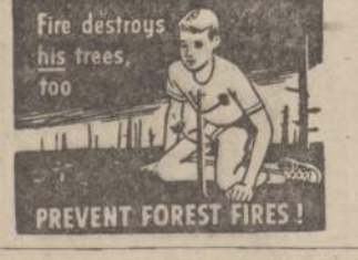
Fire destroys his trees. 100 PREVENT FOREST FIRES!