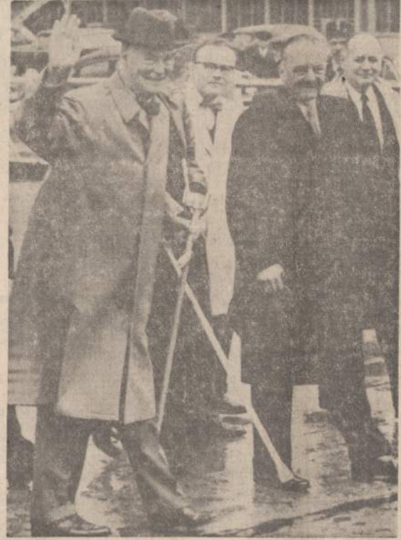
JAV valst. departamento sekr. Christian A. Herter atvyko į Paryžių pasitarti su prezidentu De Gaulle ir susitikti su kitais Vakarų užs. reik. ministrais prieš susitikimą su sovietais Genevoje.

PARYZIUS. — Prancūzijos senato pirmininku vėl išrinktas Prancūzų Gvijanos atstovas negras Gaston Monnerville, 62 metų. Senato pirmininkas yra antras žmogus Prancūzijoje po respublikos prezidento. Jis pavaduotų De Gaulle jam susirgus ir dėl kitų priežasčių negalint eiti pareigų.