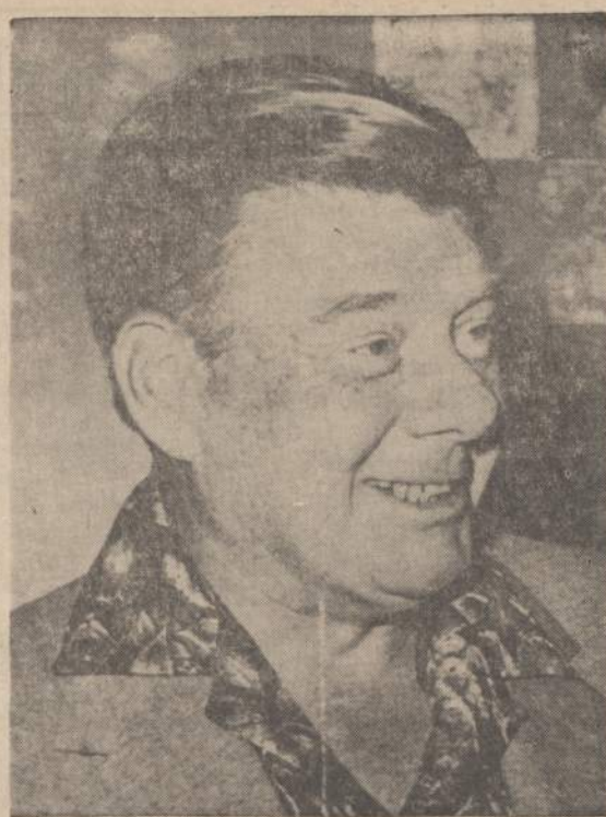
Arthur Godfrey, kuriam New Yorko ligoninėje buvo padaryta plaučių operacija, išpaujanant vėžio apkrėstą plaučių dalį.

"Naujienos" rašo: "Bet argi lietuvių tautai bei jos kultūrai jau gresia išnykimas, kad tokia saugojimo vieta (Honduro koloni- ja L. D.) pasidarė reikalinga? Ką bekalbėtume apie rusiškos okupacijos žalingumą, vis dėlto ir okupuotoje Lietuvoje kultū- ra nenyksta; nors slopinama ir bolševikiškai dorkoma, ji yra gyva, nuolatos gamina šį tą naują". Čia reikia pabrėžti, kad