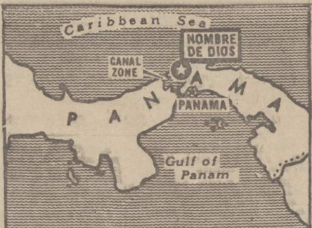
Panašiai kaip Kuboje dabar prasidėjo Panamoje, kur laiveliais atplaukę grupė sukillelių užėmė vieną pajūrio kaimą ir pradeda revoliuciją tikslu nuvertinti valdžią. Panamos patulinės valtyis apsaudė sukillelių užimtą kaimelį Nombre de Dios (paženklintą kryžiu), kelela jų sužeidžiant ir gal užmušant.

"Aukšų reikėjo sukrauti į vagonus taip, kad nė šuo nesuolotų, kad nepasklistų mieste gandais, dar ešeloniui neišejus. Uždaviniui kruopščiai ruošėmės: rinkome patikimus banko tarnautojus, šoferius ir krovikus, o taip pat geležinkelio stoties darbuotojus. Šiam atsakingam darbu vadovavo specialii komisija, laikydama-