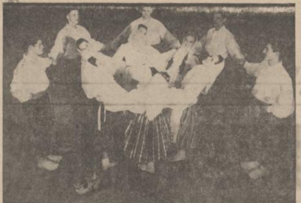
Clevelando Grandinėlė šoka šį šeštadienį, 7 val. vak. punktučiai, Jaunimo Centro salėje, 5620 So. Claremont Ave. Koncertą rengia Vidurinių Vakarų Sporto Apygarda, kuri kviečia visus atsilankyti.

— "Santienos" reikia Darbo, namo, buto reikia —