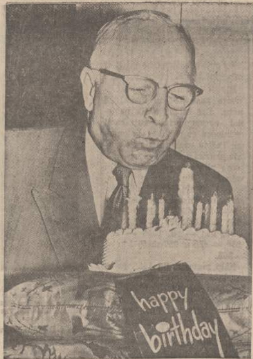
Buv. prezidentas Harry S. Truman gėmina žvakėles jo 75 metų sukaktuvėms iškeptame torte. Demokratų partija 16 miestuose iškilmingai šventė jo sukaktį.

Anglikonų Katalikų Bažnyčia, atšmetusi nuo Romos. Nei dogmomis, nei apeigomis ji nesiskiria nuo Romos Katalikų Bažnyčios, tik ji nepripažįsta popiežiaus autoriteto.