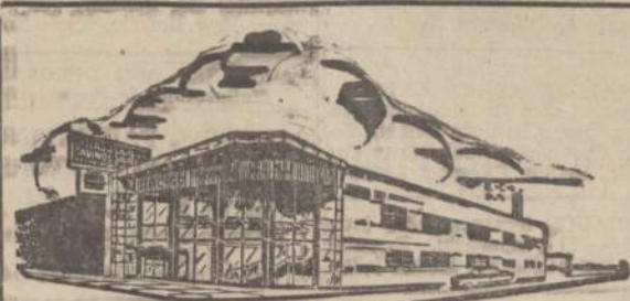
Chicago Savings and Loan naujoji įstaiga

ATDARA: Pirmadienį 12 iki 8, antradienį 9 iki 4, trečiadienį uždaryta visa diena. Ketvirtadienį ir penktadienį 9 iki 8. Seštadienį 9 iki 12:30 val.