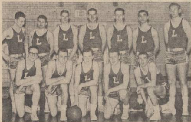
Krepšinio Rinktinė, kuri šių metų liepos mėnesį vyks į Pietų Ameriką.

Yra labai daug priemonių, kaip galima įgyvendinti vieningumo principą tarp jaunosios ir senosios kartos ateivių arba čia gimusio ir atvykusio jaunimo.