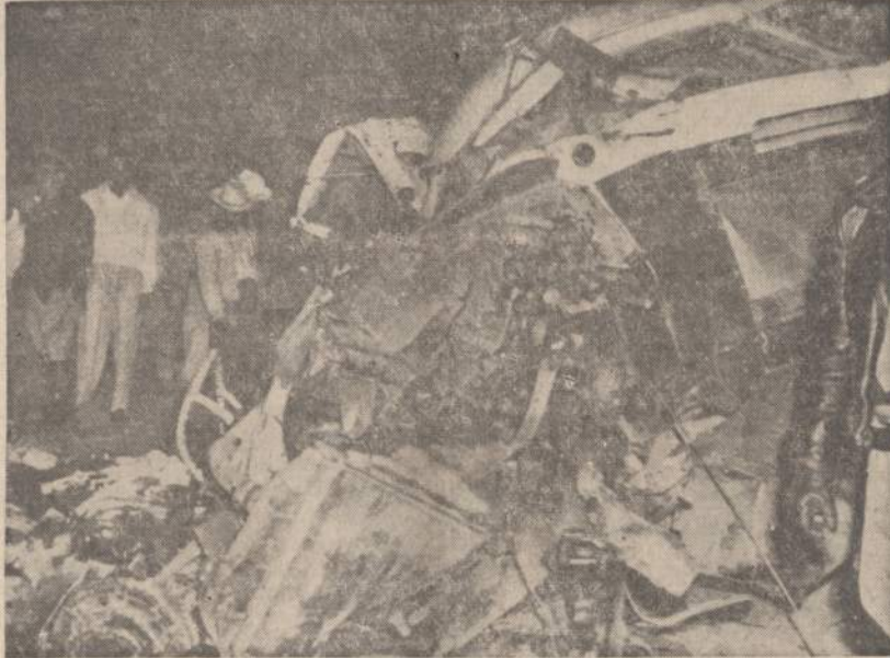
Greitasis Vera Cruz keleivinis traukinys užvaliovo autobusa ir štai kas iš jo beliko. Praneša, kad 17 žmonių buvo užmušta ir tuzinai sužeista. Autobusu važiuo turistai.

— Latvijos komunistų partijoje tik 32% latvių. Išvedant iš atstovų sudėties Aukščiausioje taryboje, EZD prieina išvados, kad Latvijos komunistų partijoje latvių tautybės narių yra tik 32%, kiti rusai ir kitos tautybės. Latvijos kp esą apie 61,000 narių. (E)