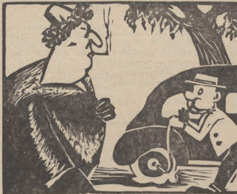
Pumpuok, Jurgi, greičiau, kad į Naujienu pikniką suspėtum.