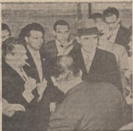
Andrei Gromyko, sovietų užsienio reikalų ministras, Vakarų Vokietijos užsienio ministerių Heinrich von Brentano pareiškė, jog Ženevoje bus aptariami tik sovietų patiekti planai. Vadinasi, tuo būdu jis davė suprasti, jog sovietai iš anksto yra nusitarę atmeti bet kokius vakariečių pasiūlymus. Šioji Gromykos nuotrauka buvo nuimta, kai jis išėjo iš britų už. reik. min. S. Lloyd rezidencijos.

Viršūnių konferencija tada įvyko Ženevoje ir atrodė, kad buvo pasiekta taikingo kooperavimo susitarimas su Sovietų Sąjunga, kuriai atstovavo tuometinis premjeras Nikolai Bulganin, padedamas Chruščiovo. Po konferencijos buvo daug rašoma apie "Ženevos dvasią", menamai išskleidžiusią tamsius debesis tarptautinės politikos padangėje. Bet po kelių savaitių viską, kas Ženevoje buvo sutarta, Kremlius atmetė!