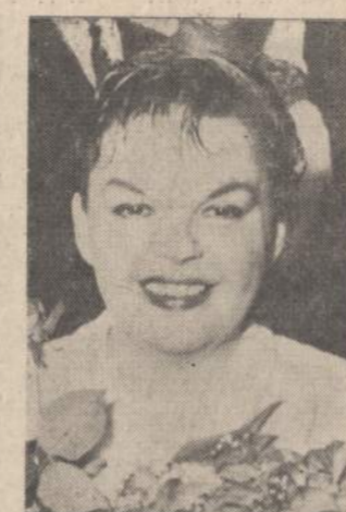
Zinoma dainininkė Judy Garland labai sėkmingai debiutavo New York Metropolitan Operos rūmose, dainuodama vėdevilnio pobūdžio veikale. Ji buvo išaukta keturiolika kartų. Parengimas buvo surengtas naudai ligoninės, kur tyrinėjama vaikų dusuly.

Bijosi monopolio Bankų skyrių steigimo biliaus šalininkai savo argumentus pateikė praeitą savaitę. Jie argumentavo, kad tolimesnės miesto ir užmieščių srities nėra pakankamai aptarnaujamos vietinių bankų.