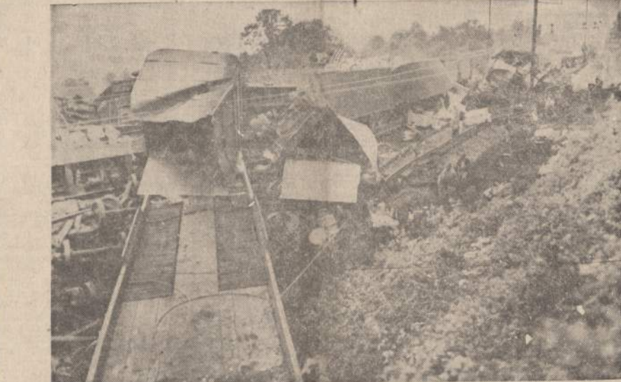
Novirtis prekinis traukinys, kurį užvažiavo Pensilvanijos geležinkelio greitasis keleivinis prie Paoli, Pa. Susidūrimas įvyko dėl to, kad prieš pat keleiviniam traukiniui pravažiuojant, tas 44 vagonų prekinis nubėgo nuo bėgių. Vienas keleivis sužeistas.